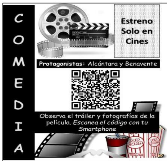
Figura 5 Propuesta publicitaria N° 1

La Figura 4 muestra una estrategia introductoria para posteriores campañas de marketing basadas en códigos QR, la cual propone la entrega de material publicitario con un código QR impreso, el mismo que será entregado a potenciales clientes.