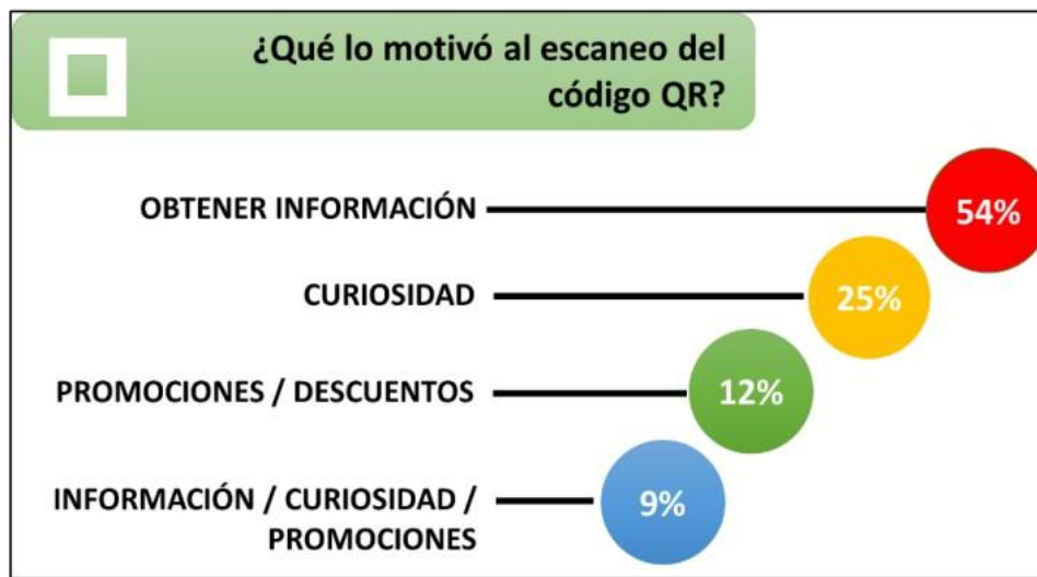
Figura 2 Motivos de escaneo

Los resultados de la encuesta sustentan lo concluido en el proceso de observación, llegando a ser la falta de interés, curiosidad o motivación el error común de la mayor parte de las estrategias publicitarias desarrolladas por las organizaciones.