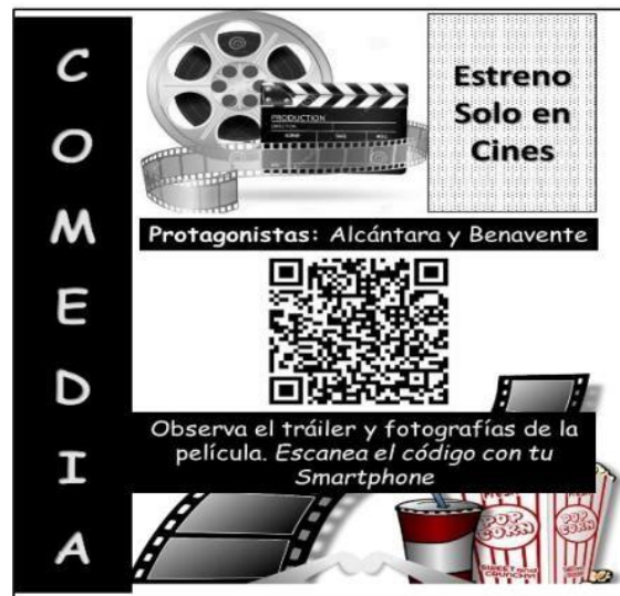
Figura 5 Propuesta publicitaria N° 1

La Figura 4 muestra una estrategia introductoria para posteriores campañas de marketing basadas en códigos QR, la cual propone la entrega de material publicitario con un código QR impreso, el mismo que será entregado a potenciales clientes.