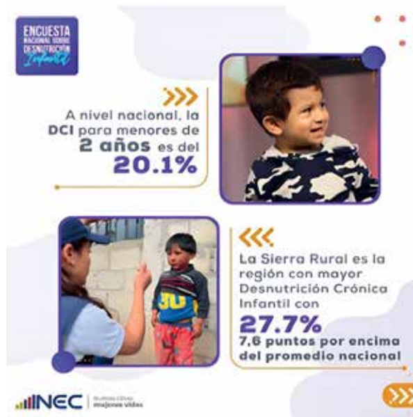
Figura 1. Encuesta Nacional Sobre Desnutrición Infantil