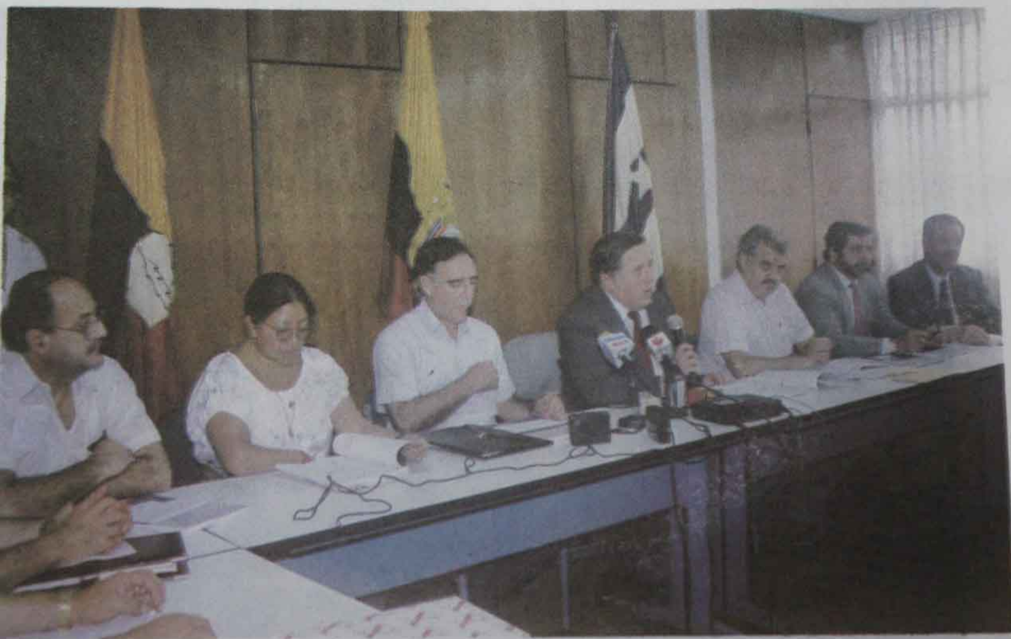
Foto 14 Foro "Alternativas de Políticas para la Construcción de una Sociedad Democrática" (29 y 30 de julio de 1998).