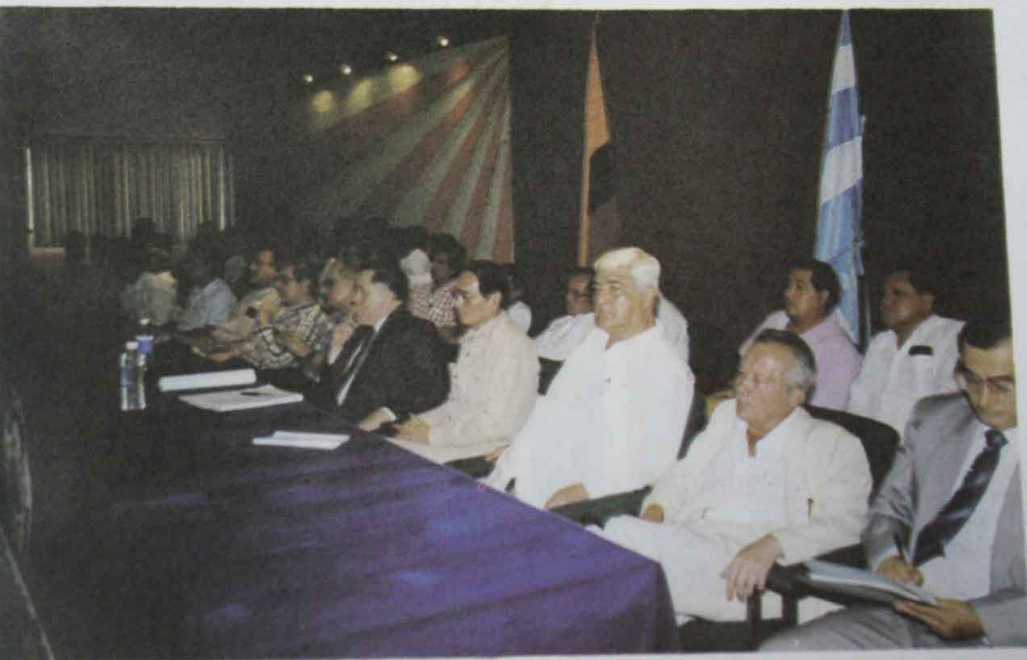
Fotos 17 y 18 Asamblea Universitaria sobre las Medidas Económicas del Gobierno. (28 de septiembre de 1998)