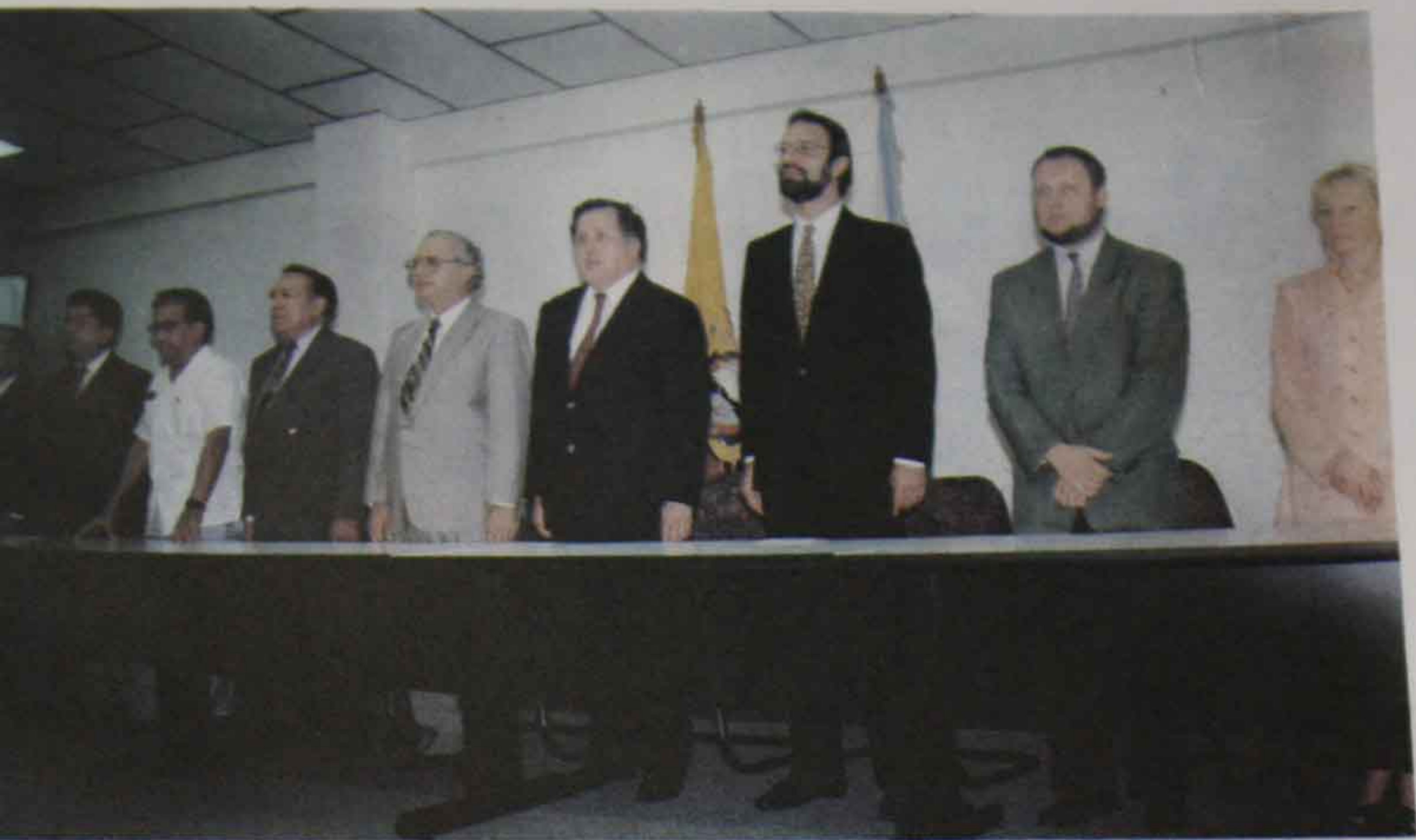
Foto 7 1er. Seminario Taller "Metodología y Enseñanza en los Derechos Humanos". (Marzo 16 al 18).