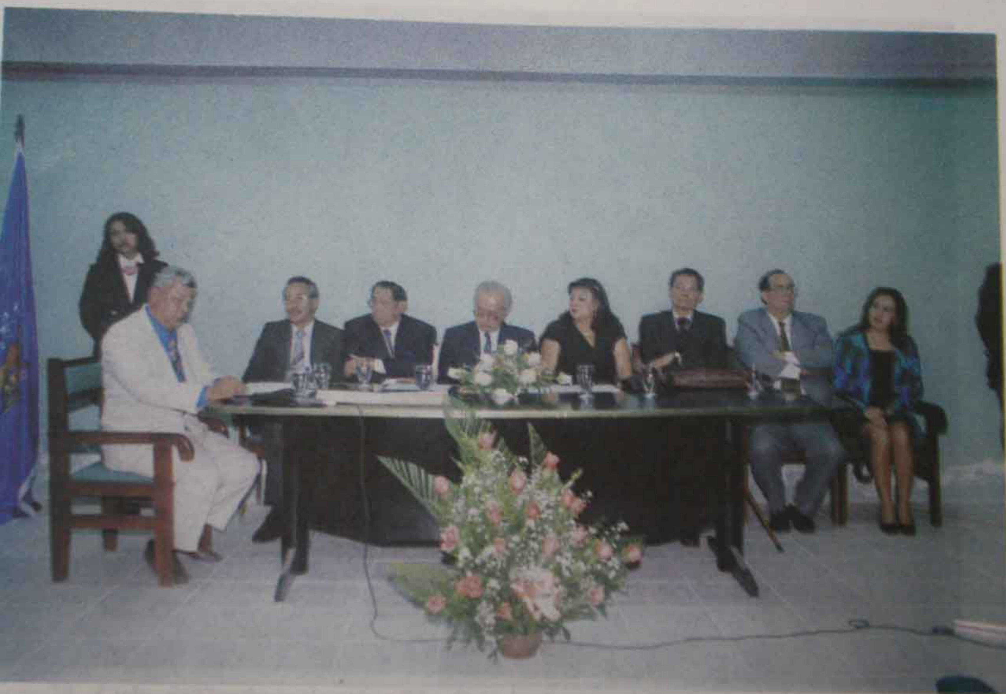
Foto 26 Sesión Solemne de la Facultad de Comunicación Social. (4 de Noviembre de 1998)