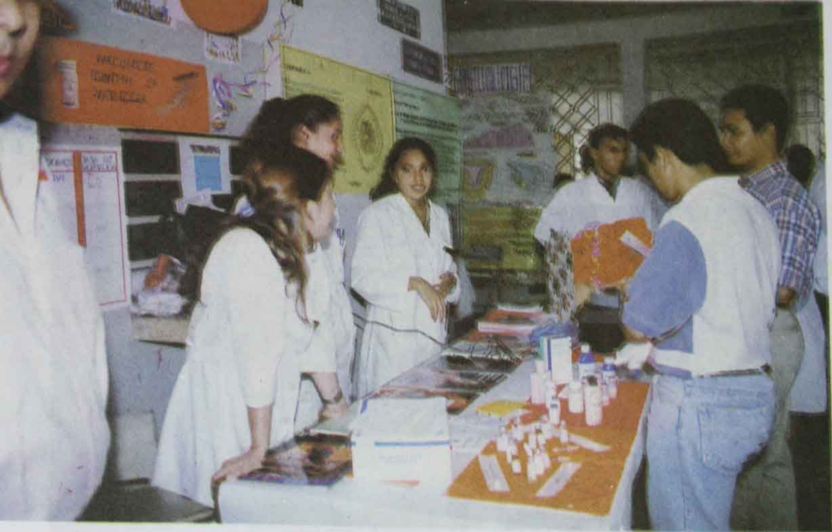
Foto 27 "Casa Abierta de la Facultad de Ciencias Médicas (6 de noviembre de 1998)