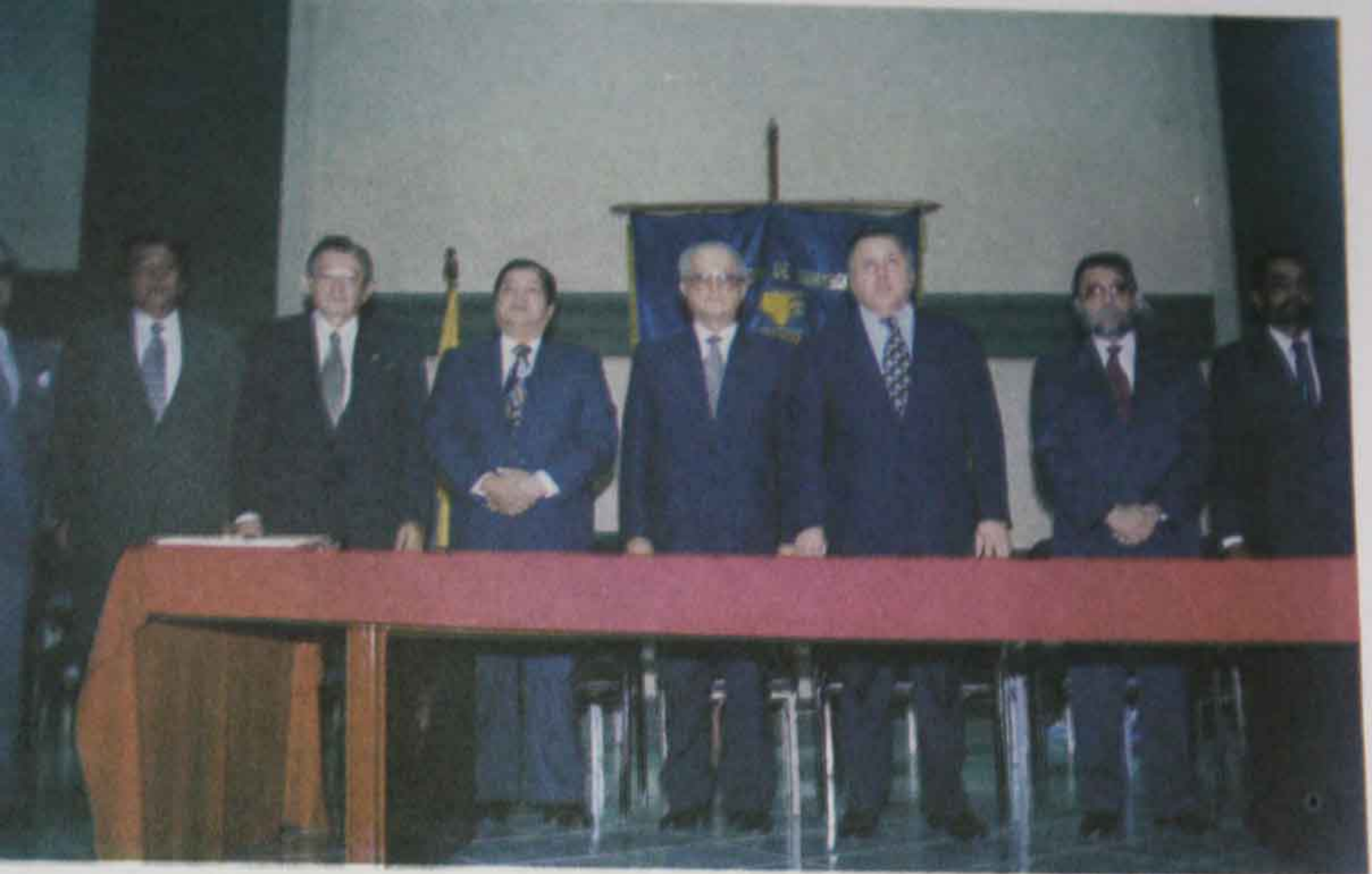
Foto 21 Sesión Solemne de Jurisprudencia en sus 130 años de creación. (16 de septiembre de 1998).