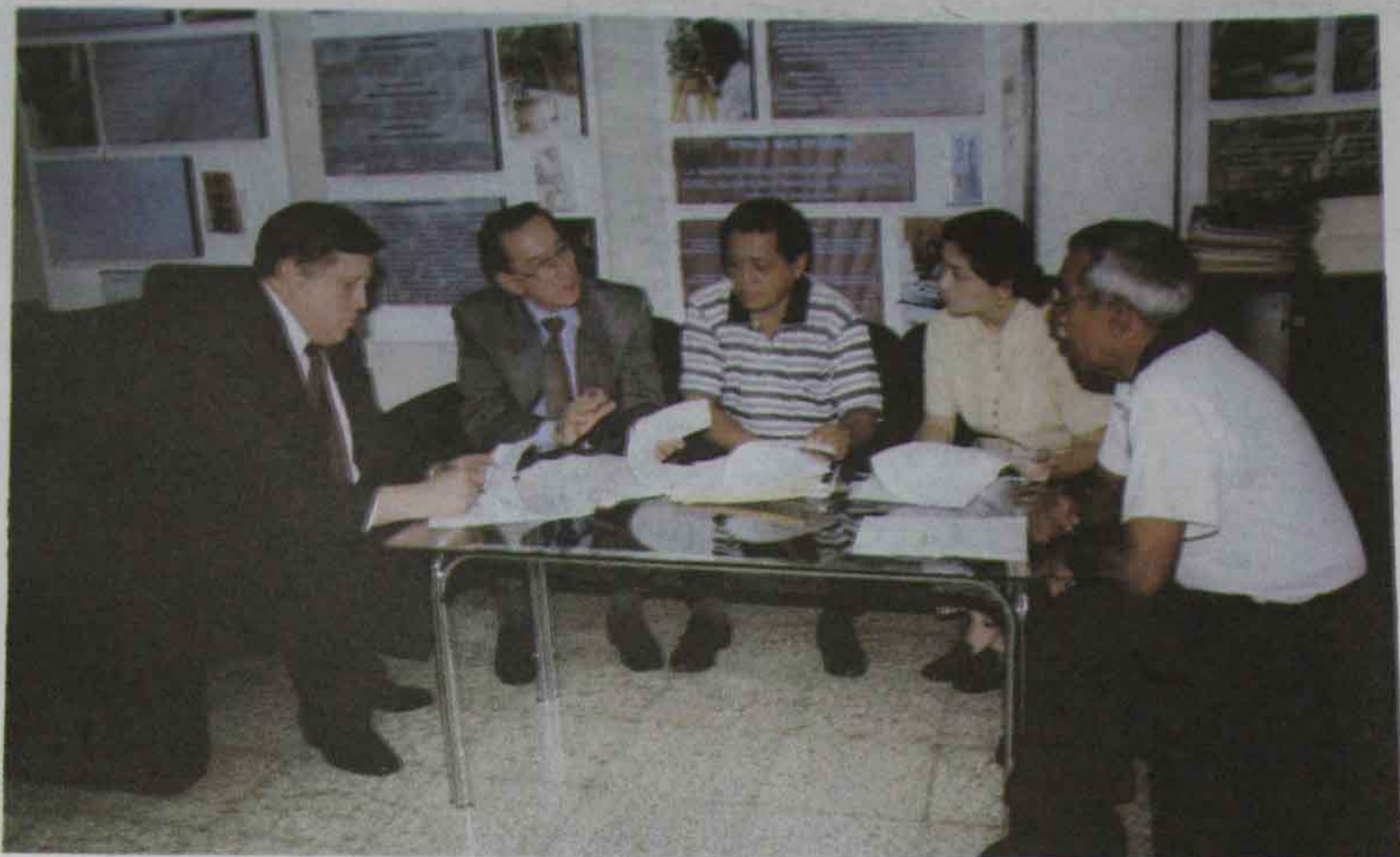
Foto 13 Firma de Convenio entre el Ministerio de Agronomía y la Facultad de Agronomía. (28 de julio de 1998).