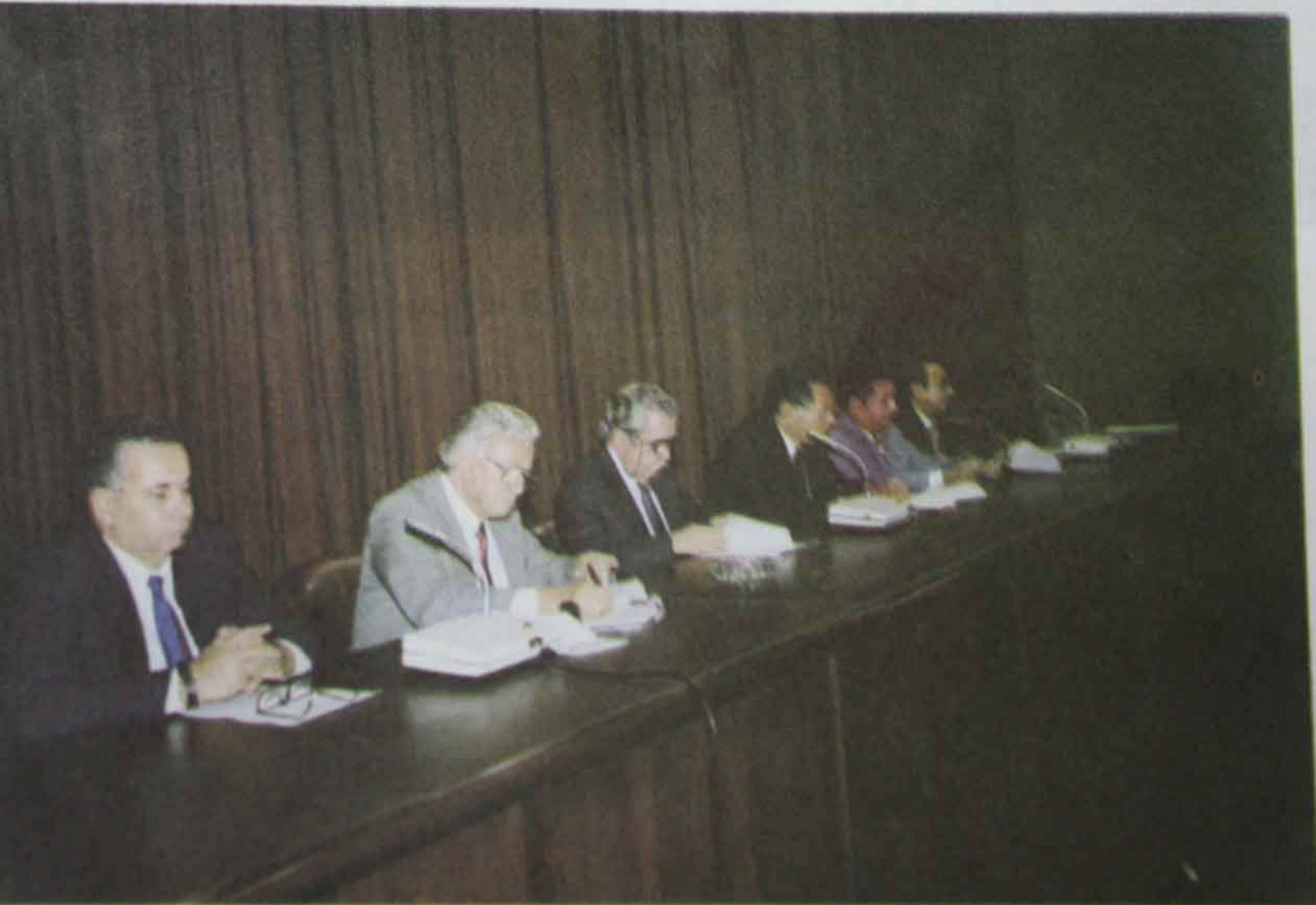
Foto 28 Ciclo de Conferencia sobre "La Criminalología y el Fenómeno Delictivo" realizado por la Facultad de Jurisprudencia. (16 de Noviembre de 1998).