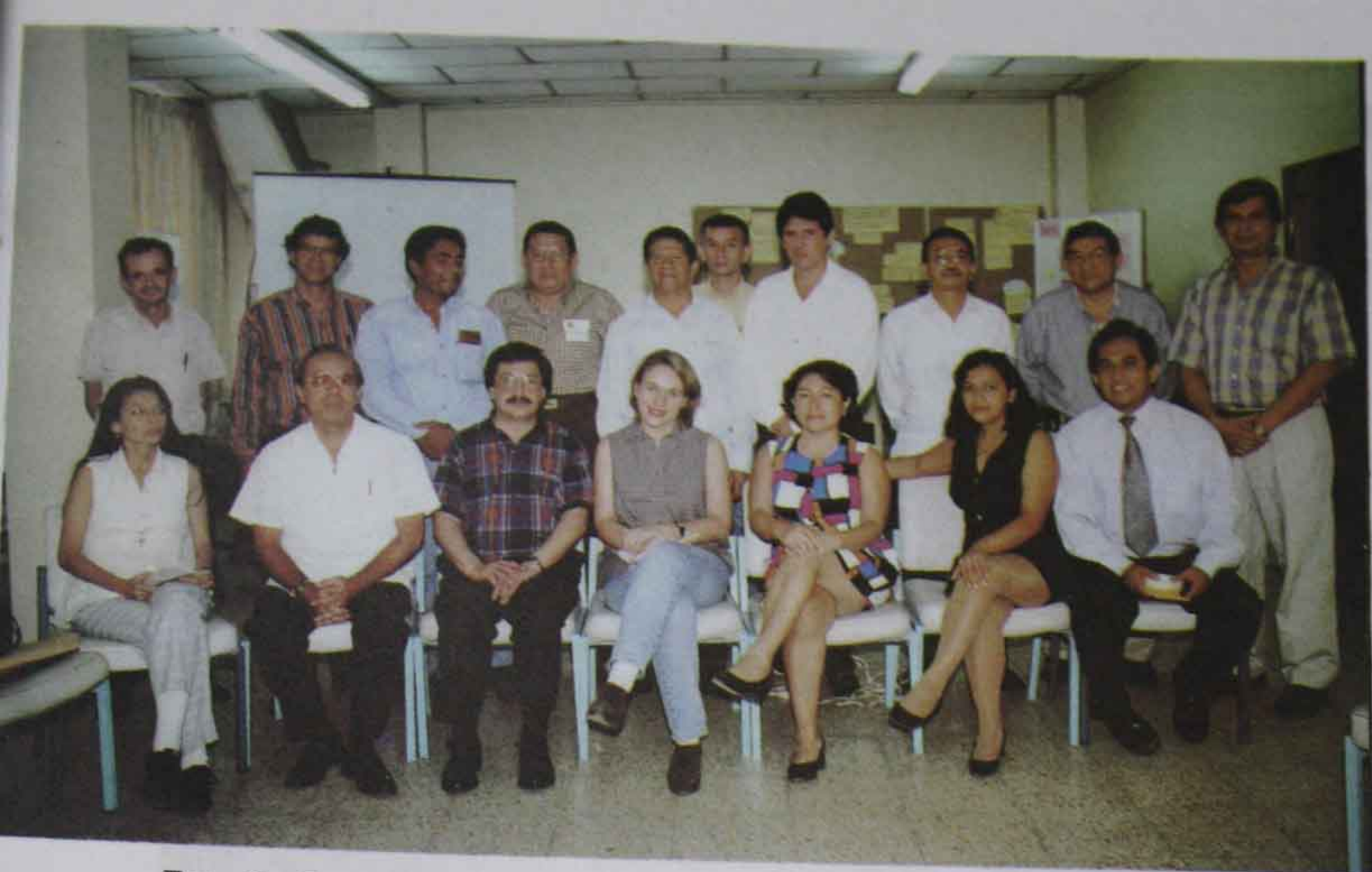
Foto 9 Inauguración del Seminario Taller de Comunicación. (10-11 de junio de 1998)