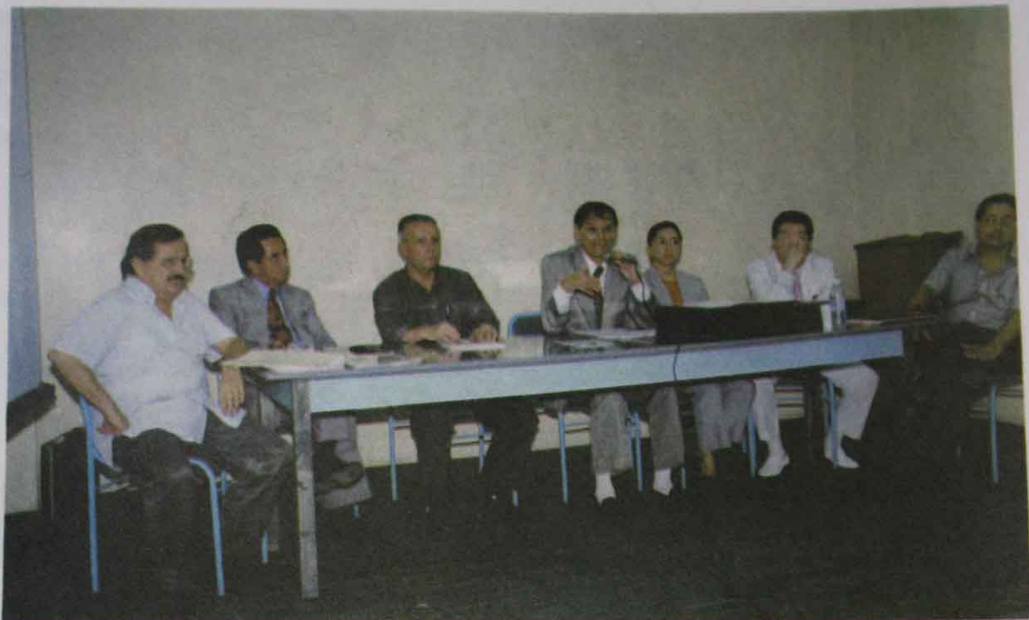
Foto 11 Unidad Ejecutiva del Plan de Desarrollo "Curso para los Altos Estudios Nacionales" (25 de mayo de 1998).