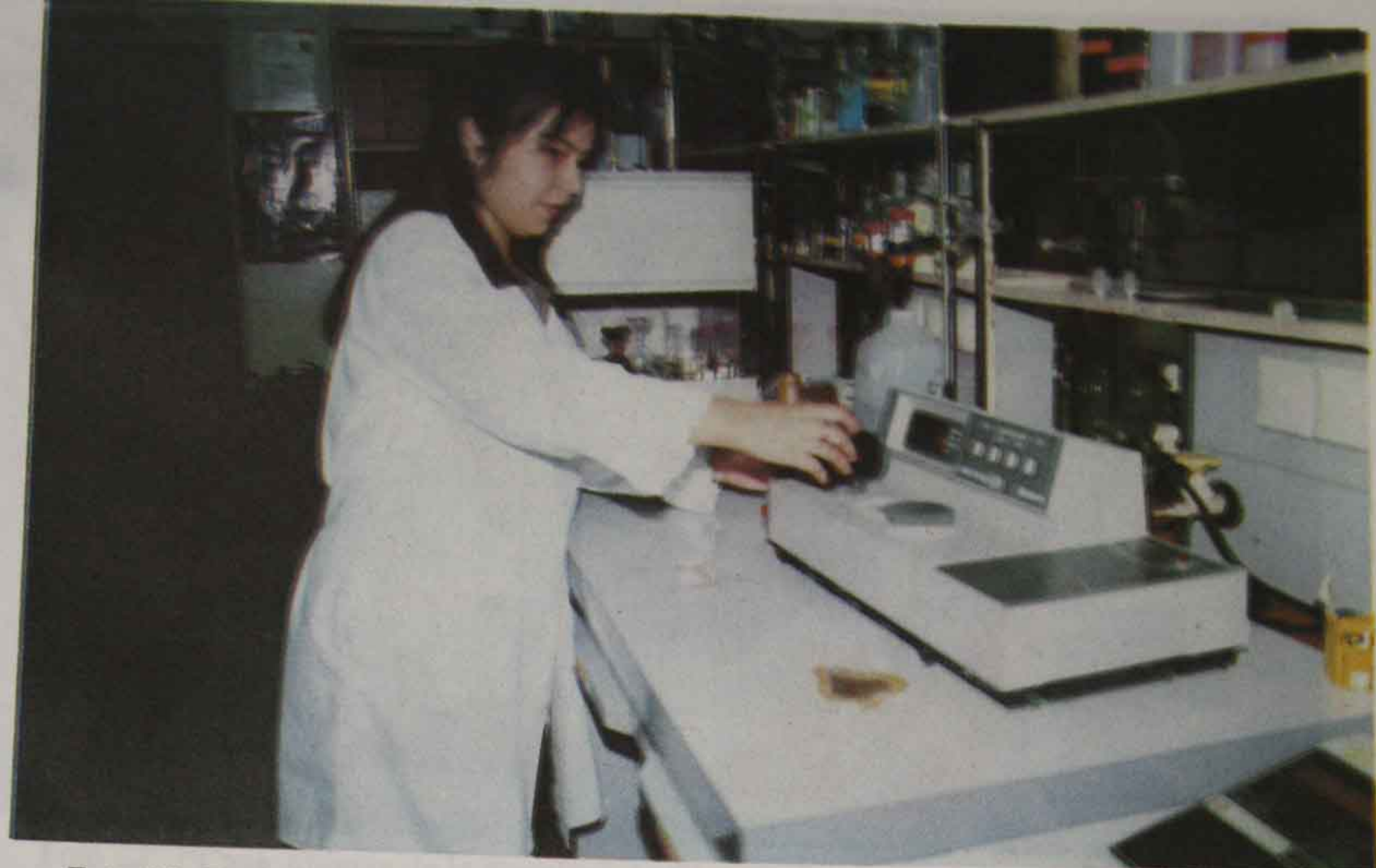
Foto 25 Ingeniería Química área de Petróleo.