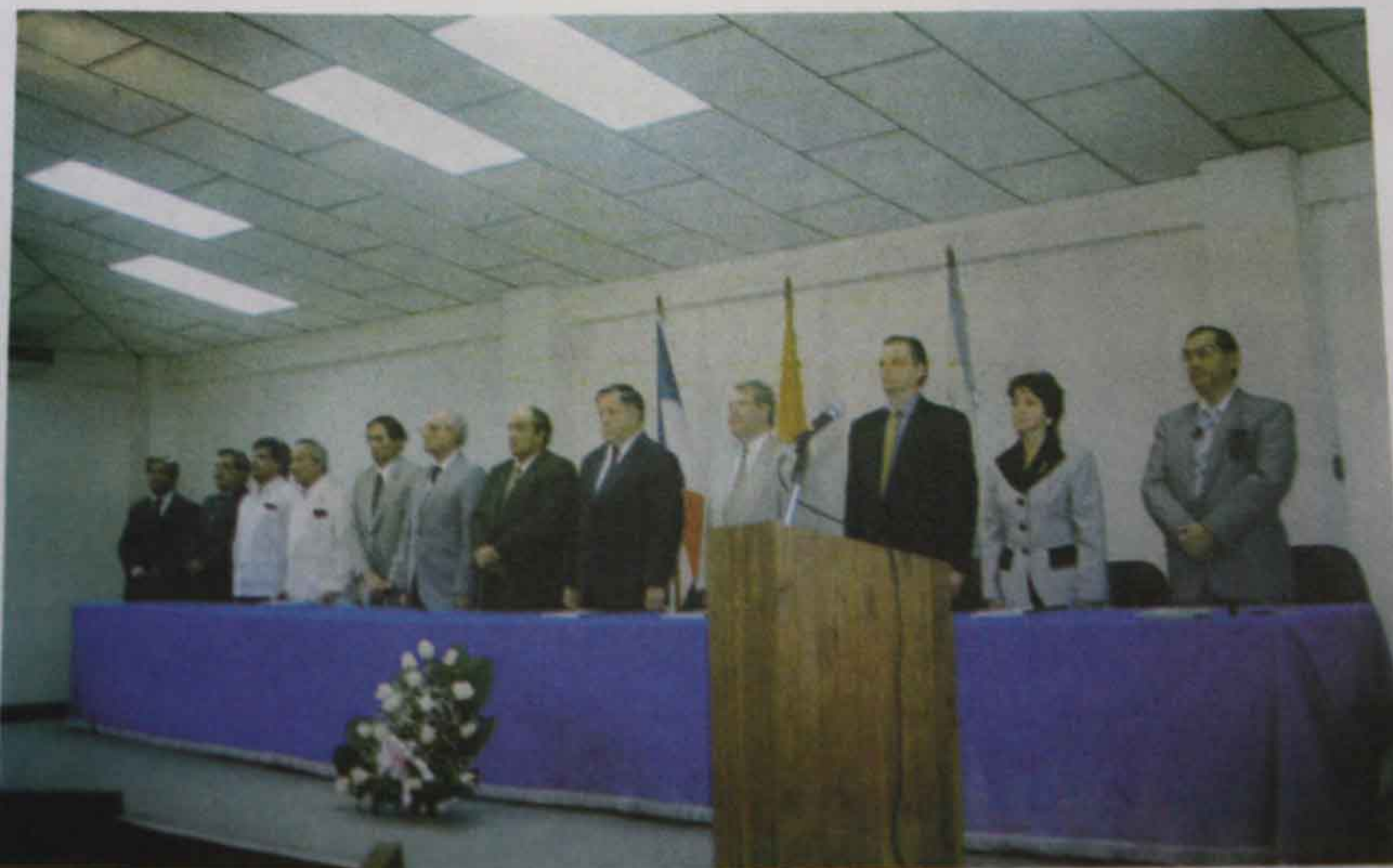
Foto 12 Firma de Convenio entre la Universidad y FUNDACYT (19 de junio de 1998).