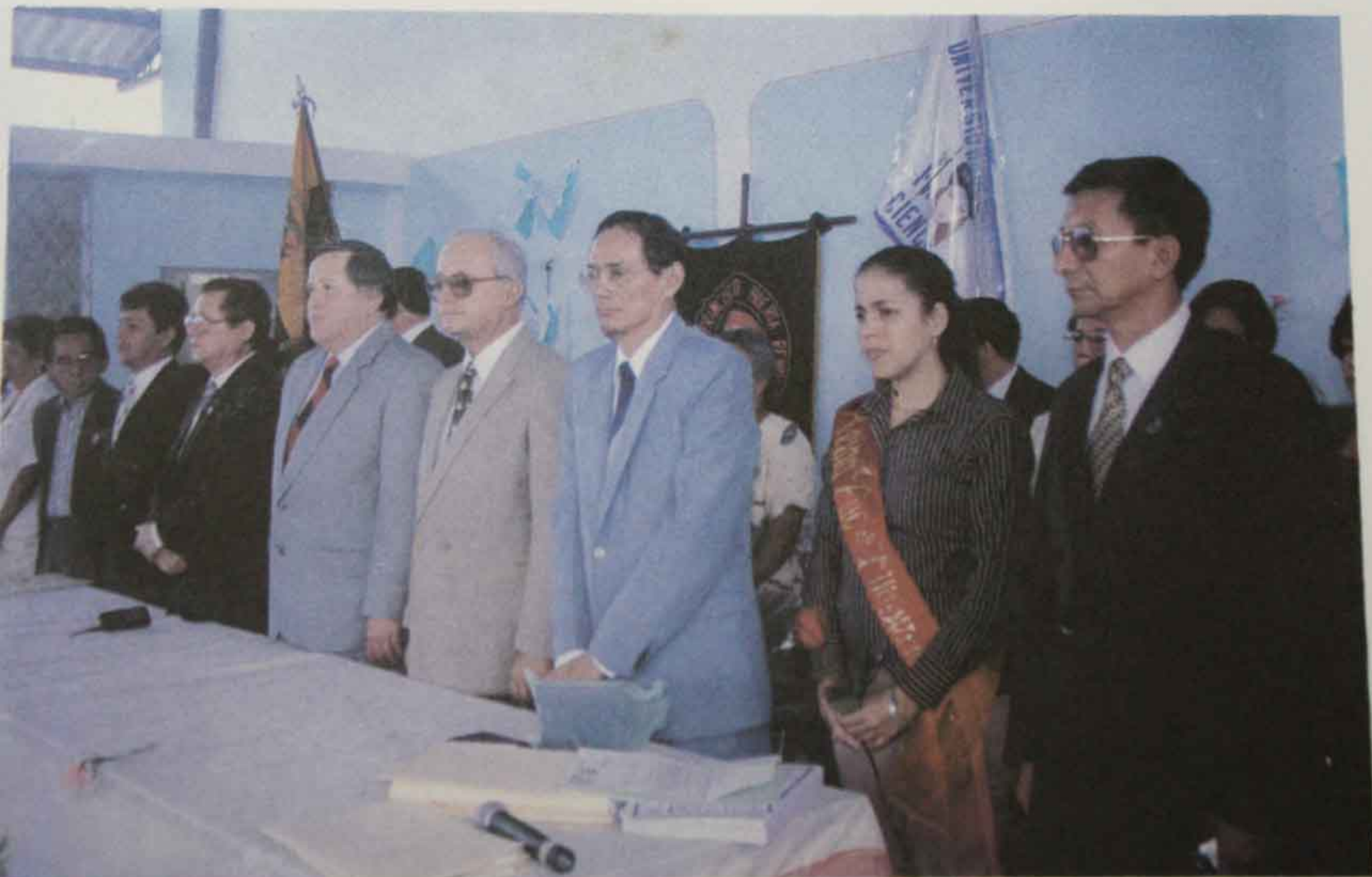
Foto 16 Sesión Solemne por Aniversario Facultad de Filosofía (26 de agosto de 1998)