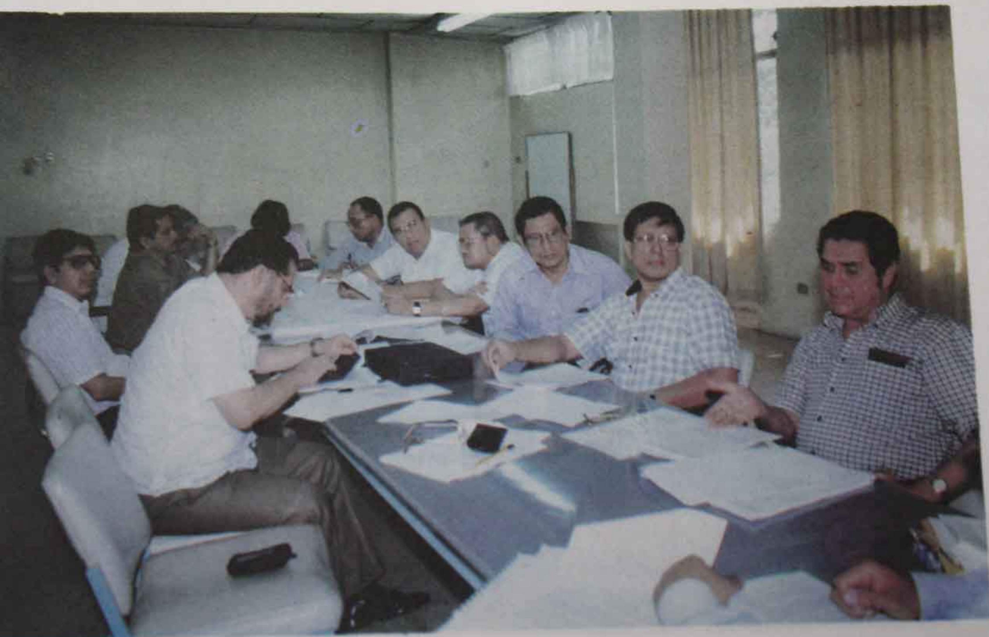
Foto 8 Seminario Taller en Gestión Tecnológica. (4 y 5 de junio de 1998)