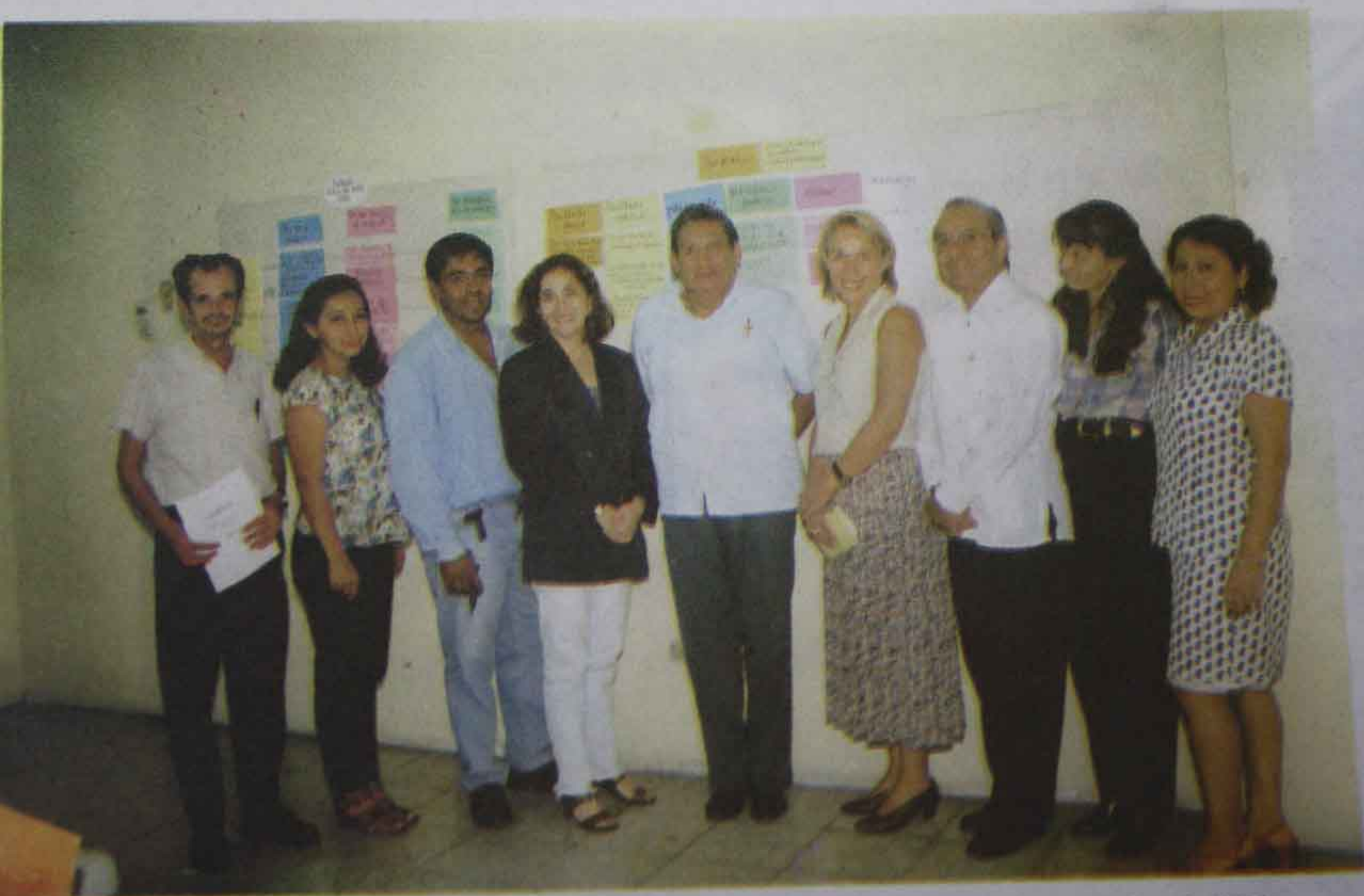
Foto 20 Clausura del Seminario Taller de Comunicación. (2-3 de septiembre de 1998).