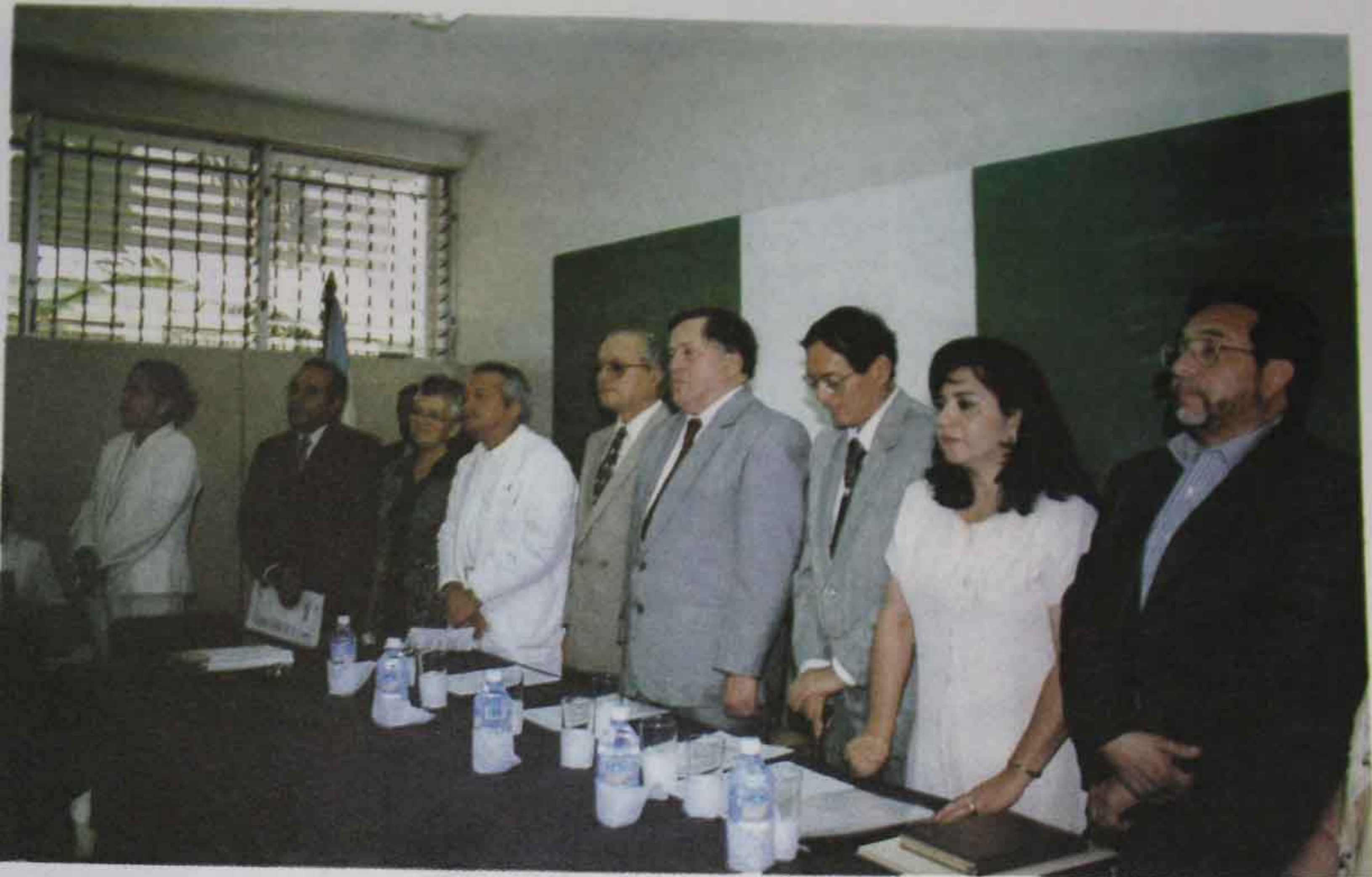
Foto 23 Sesión Solemne de la Escuela de Obstetricia (23 de octubre de 1998).