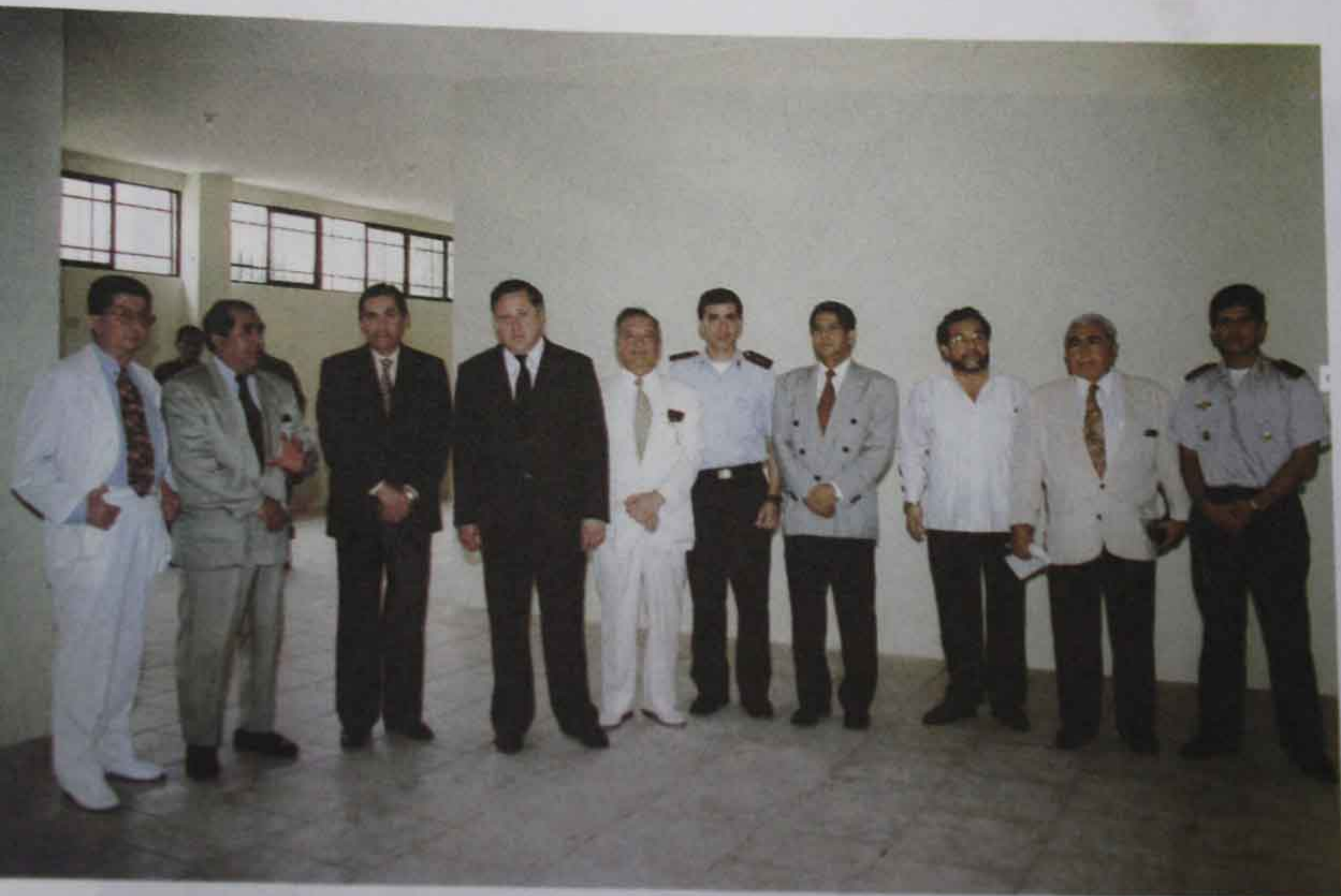
Foto 10 Inauguración Biblioteca Facultad de Ciencias Médicas.