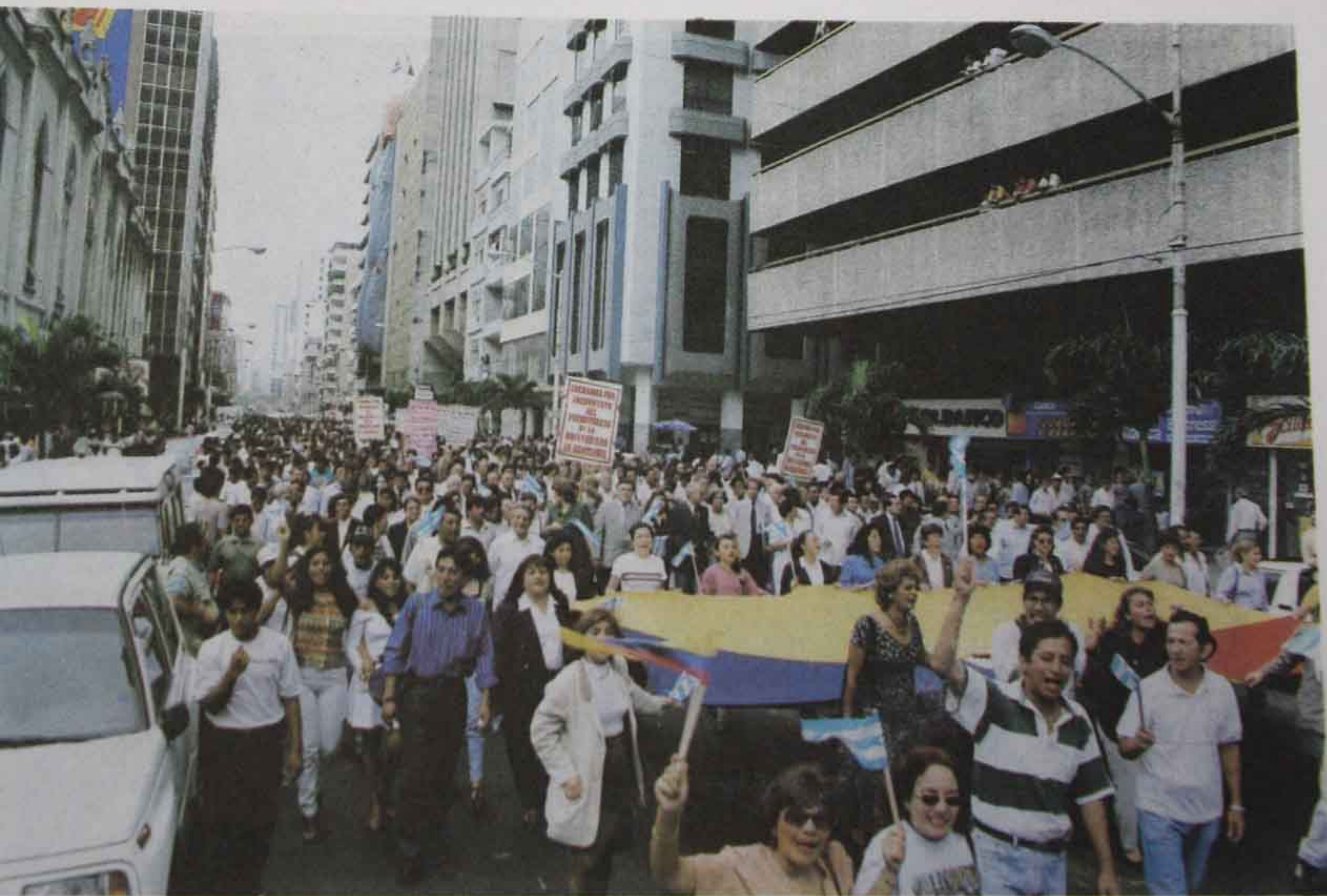
Foto 24 Marcha Universitaria hacia la Gobernación para entrega de Presupuesto. (30 de octubre de 1998)