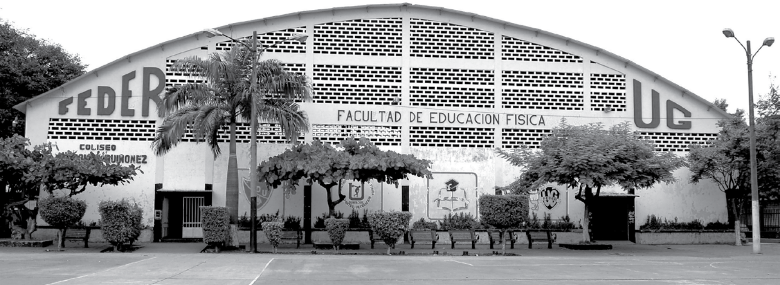
Coliseo de la facultad de Educación física