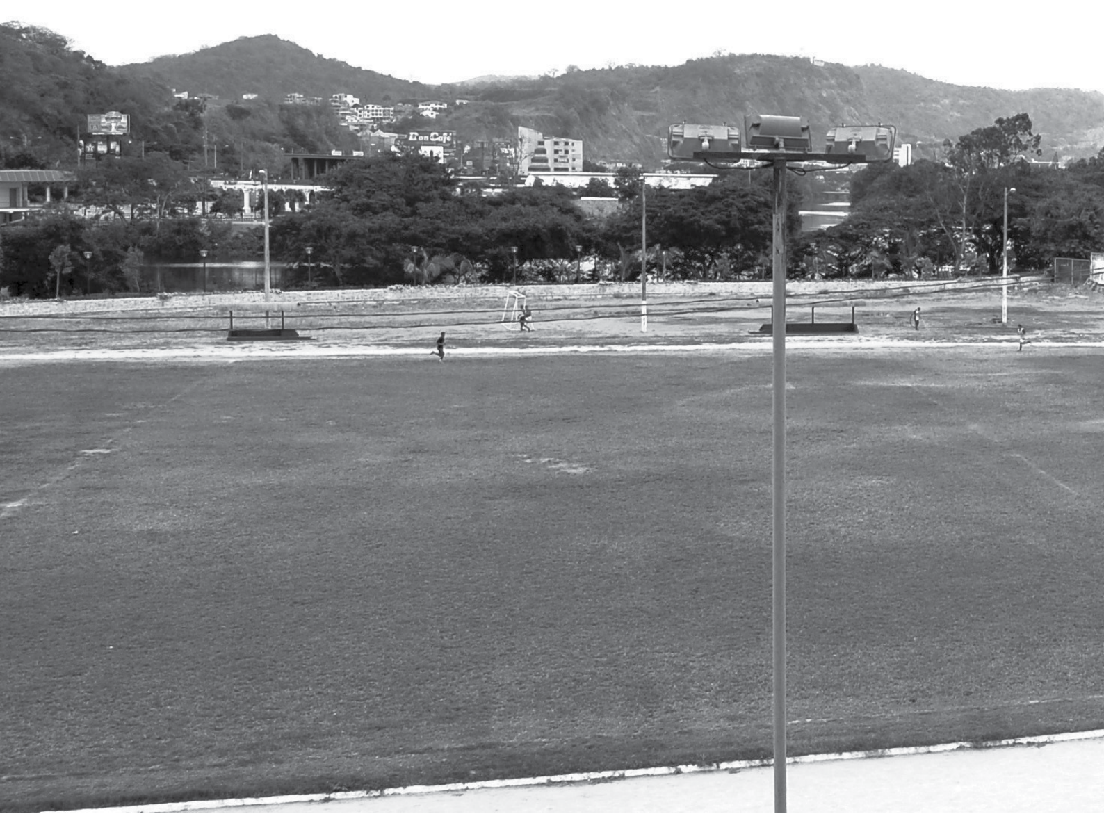
Cancha de fútbol de Feder

Dialogamos con su persona en su despacho para conocer la realidad de esta brillante Unidad Académica quien nos manifestó lo siguiente “Estamos preparándonos para el Vigésimo Primer Congreso Panamericano de Educación Física que nos toca organizar a nosotros aquí en el Ecuador en el mes de julio del 2009”.