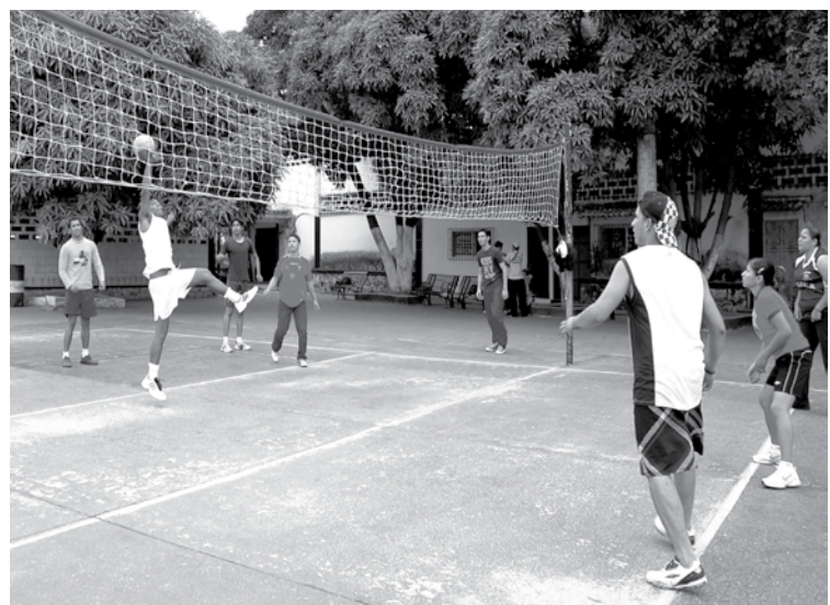
Patios y canchas de volleyball donde los estudiantes entrenan