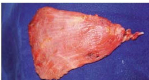
Foto 9: Colgajo muscular libre del Gran dorsal listo para transferencia microquirúrgica, nótese el pedículo vascular (arteria y vena) en el extremo izquierdo.