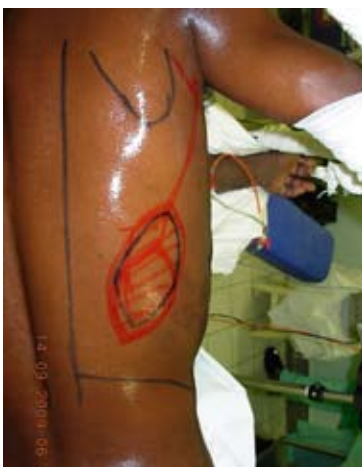
Foto 8: diseño del colgajo del músculo gran dorsal.