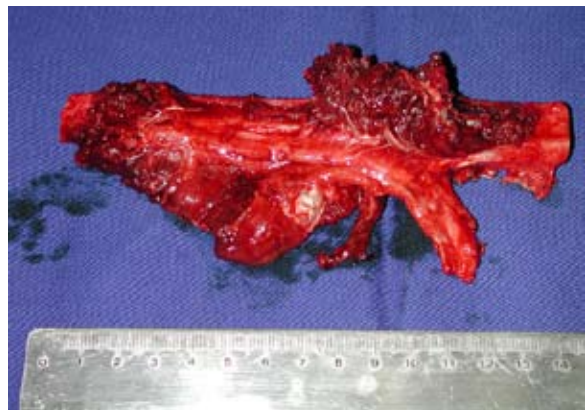
Foto 1: Colgajo libre de Fíbula listo para su transplante en reconstrucción de cáncer de mandíbula; nótese el pedículo vascular en el lado derecho.

Las disecciones se realizan con la ayuda del microscopio o lentes de magnificación llamados lupas. (Fotos 2-3). con lo que se logra una mejor técnica en el manejo de estructuras y con menor daño a los tejidos.