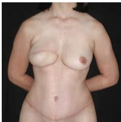
Foto 5: Post-quirúrgico de 1 año, mediante reconstrucción mediante colgajo Microquirúrgico DIEP. Nótese el buen aspecto obtenido de la mama y la zona donante en el abdomen