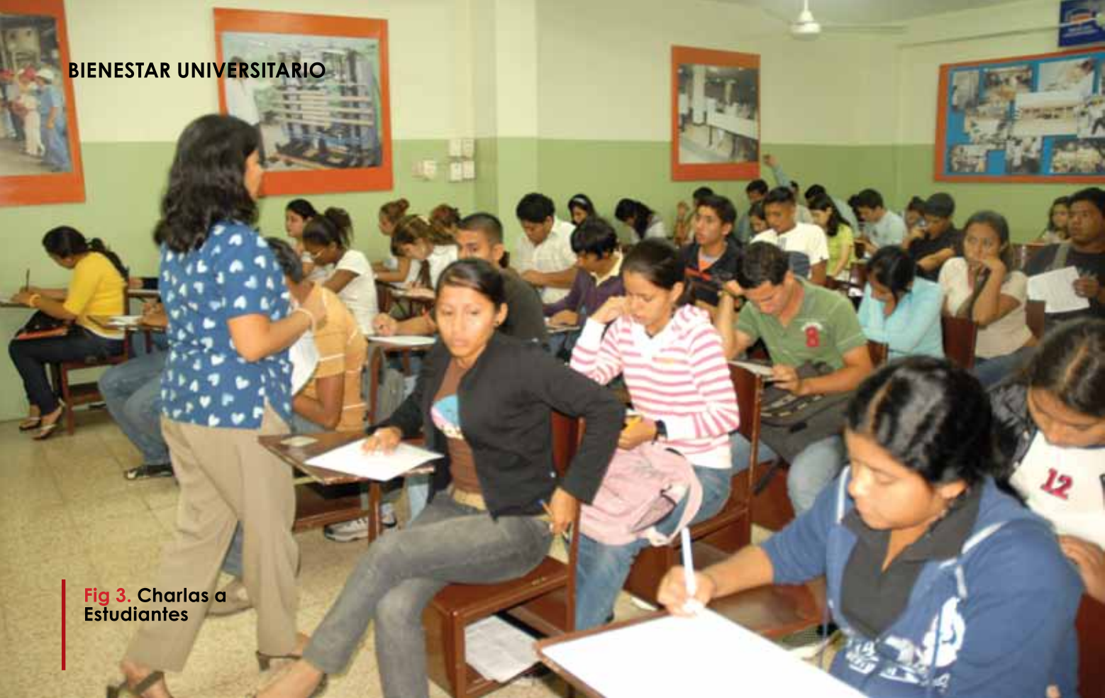
Fig 3. Charlas a Estudiantes

PROGRAMA DE CHARLAS DE ORIENTACIÓN Y FERIAS DE UNIVERSIDADES, DIRIGIDAS A LOS ESTUDIANTES DE LOS SEXTOS CURSOS DE LOS PLANTELES SECUNDARIOS DE LA CIUDAD, CANTONES Y PROVINCIAS.