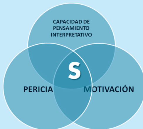
Figura 6. Los aspectos a desarrollar en el investigador de significados