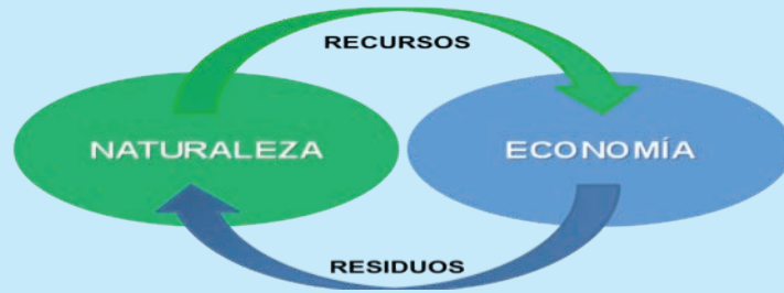
Figura 2. Representación del paradigma clásico de la economía tradicional