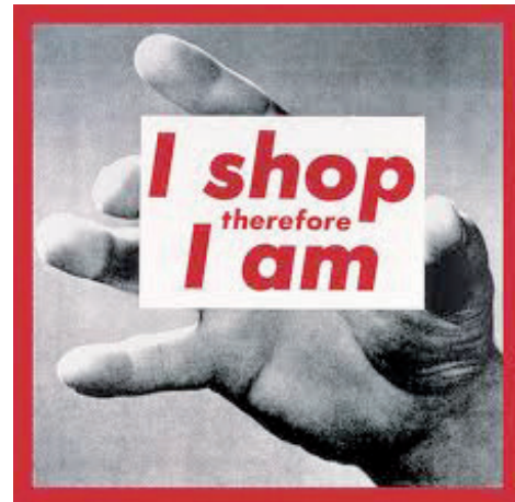
Figura 1: arte conceptual de Bárbara Kruger “I shop, therefore I am”.