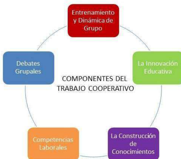
Figura 1. Componentes del trabajo cooperativo.

Los componentes del trabajo cooperativo, se basa principalmente, en adecuar de forma clara, sencilla, accesible y determinante, una serie de componentes que, al consolidarse, se obtienen resultados positivos en el desarrollo y destreza, en este caso, de los niños/as de preescolar (AdellL y Castañeda, 2010). Estos componentes son: