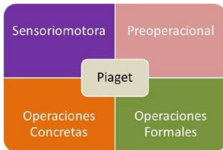
Figura 2. Etapas de Piaget.

Fuente: Adaptado de Piaget (1975). Piaget's Theory - The process of child development.