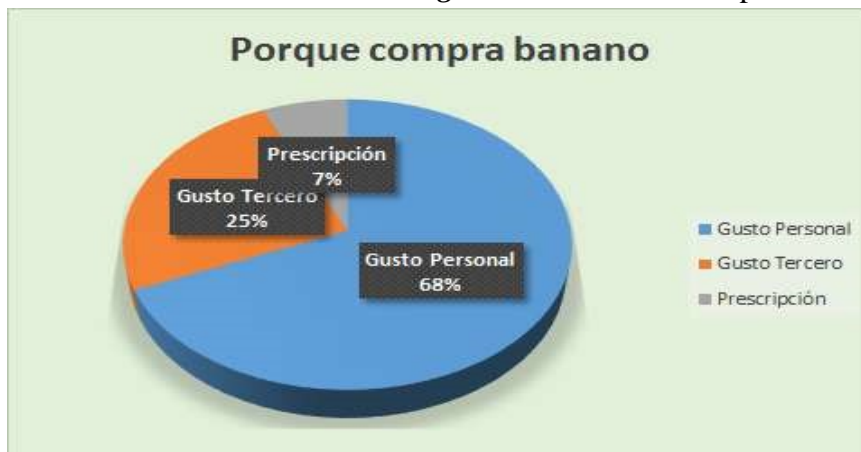
Figura 3: Motivo de compra