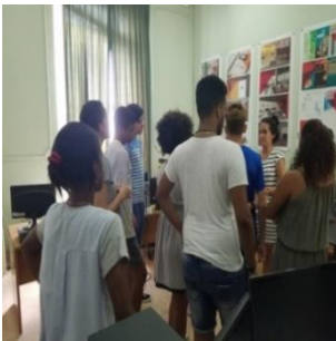
Figura 4. Adolescentes y jóvenes participando en el taller "Aprendiendo a Proyectar".

Desde julio de 2017, RESTAURA convoca, auspicia y organiza el Taller de Verano para Adolescentes “ Aprendiendo a Proyectar ” (figura 4). Con una semana de duración, el cronograma de actividades prácticas y teóricas, fue concebido para el disfrute creativo, el intercambio de saberes, y el conocimiento de la historia de la ciudad, lo cual permite a los jóvenes asistentes visibilizar y comprender el trabajo detrás de la restauración y los valores del patrimonio construido del Centro Histórico, siempre en relación con el quehacer de RESTAURA.