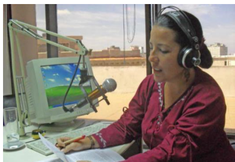
Figura 2. Programa radial Habáname.

Otro espacio de promoción y rescate del patrimonio construido, en el que especialistas de RESTAURA tienen una gran participación es la Radio. En este sentido, se tiene presencia en la emisora Habana Radio (figura 2) “ La voz del patrimonio cubano ”, particularmente en Habáname, revista semanal dedicada al patrimonio inmueble, así como en la redacción de artículos en la página web de la propia emisora y en la realización del guion del programa televisivo Andar La Habana.