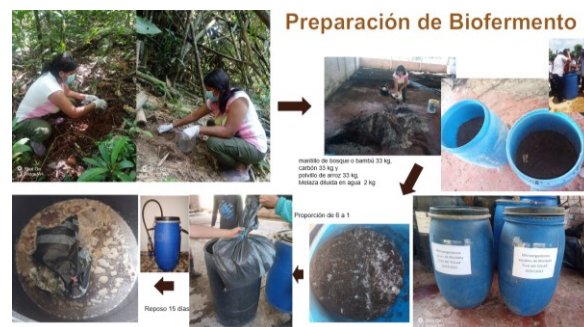
Figura 1. Preparación del Biofermento de bambú.

Después de 30 días, se realizó la fase líquida. Se utilizaron dos cilindros de 100 L (mantillo de montaña y bambusal). Se utilizó 12 kg de fermentación de fase sólida anaeróbico, 2 kg. de cepa de fase aeróbica en una bolsa filtrante con una piedra dentro para que no se elevara. Luego se agregó el agua a 2/3 con 4 litros de melaza y luego se cubrió el tercio restante del agua hasta que alcance los 100 litros. Finalmente, se dejó cerrado herméticamente durante 15 días. Al culminar, se encuentra listo para su aplicación. (Ver figura 1).