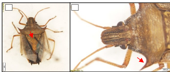
Figura 2.- Oebalus pugnax (a) Vista dorsal hembra adulta, escutelo en su totalidad amarillo con pequeños puntos negros. (b) Espinas en el humero dirigidas de manera anterolateral.