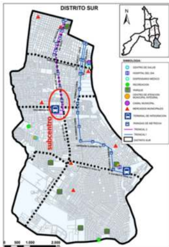
Plano del distrito sur y las intervenciones municipales más significativas

Por otra parte, es necesario hacer notar los distritos especiales -como el distrito norte que contiene una