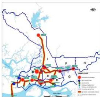
Los distritos y los centros comerciales y de servicio público

ámbito se enmarca más en la planificación y la administración. No existen funciones legislativas al interior de cada distrito. El verdadero poder ejecutivo reside en el alcalde y las funciones legislativas recaen en los miembros del Concejo de la ciudad.