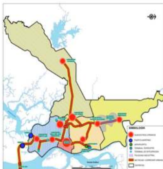
Plano integrado de los distritos, la Metrovía y los sub-centros urbanos comerciales