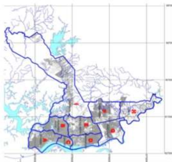
Configuración con 9 distritos