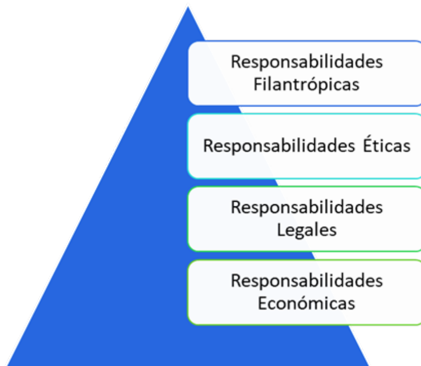
FIGURA 1. Pirámide de Responsabilidad Social.

Concluyente, la RSE centra su definición en la teoría de la pirámide de Archie B. Carroll (1987). En esta teoría se proponen cuatro tipos de compromisos acumulativos: monetarios (responsabilidad monetaria) naturales (responsabilidad legal) conductuales (responsabilidad moral) y humanitarios (responsabilidad filantrópica). En otras palabras para que una organización pueda practicar la RSE de manera responsable primero debe cumplir con su nivel anterior de responsabilidad como se muestra en la Figura 1.