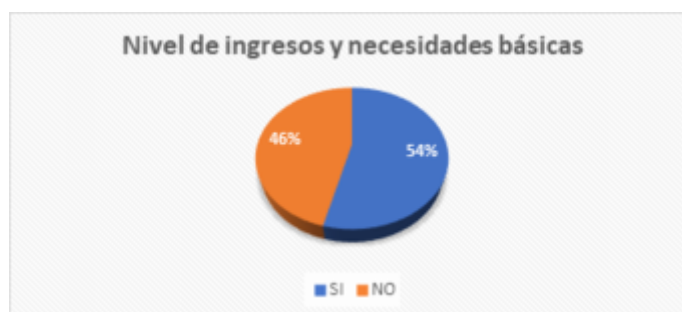
GRÁFICO 3 Nivel de ingresos y necesidades básicas

Sobre cuántas personas dependen económicamente del encuestado, los datos nos dicen que el 7% corresponde a los que tienen 4 o más cargas familiares. Es la gran minoría, por lo que es un aspecto favorable al no tener muchas personas dependientes y poder optimizar recursos; el 45% posee entre dos a 4 personas de cargas familiares y el 48% que representa la mayoría, entre 1 - 2 personas. Todo ello permite afirmar, que las familias ya no son tan numerosas como años atrás y que las personas ya pueden pensar en desarrollar su capacidad de ahorro.