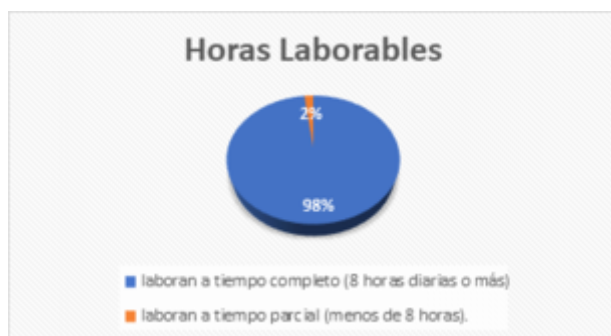
GRÁFICO 1 Horas Laborales

Investigación de campo Elaboración propia