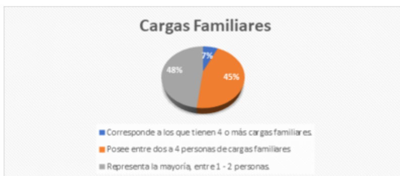
GRÁFICO 2 Cargas Familiares

Del 100 % de las personas encuestadas el 98 % labora a tiempo completo (8 horas diarias o más), mientras que solo el 2 % de las personas labora a tiempo parcial (menos de 8 horas). Se observa que prevalece la jornada de trabajo a tiempo completo.