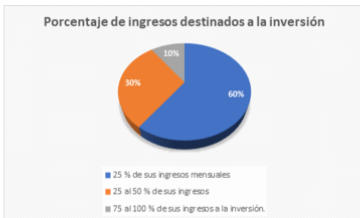
GRÁFICO 4 Porcentaje de ingresos destinados a la inversión Investigación de campo Elaboración propia

Del 100% de las personas que fueron encuestadas, el 54% cree que el nivel de ingresos cubre las necesidades de su familia, mientras que el 46% cree que no, por lo que un porcentaje significativo considera la necesidad de tener otros ingresos personales que les permita cubrir dichas necesidades y ahorrar.