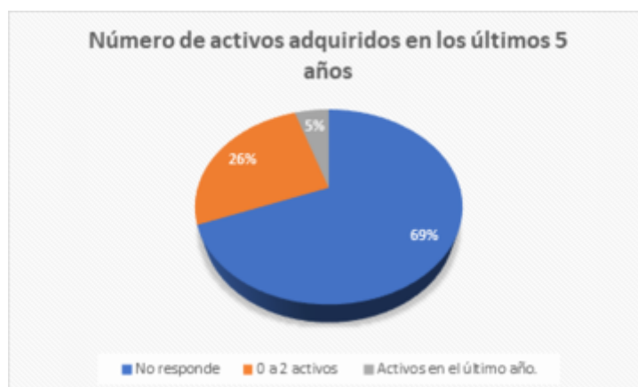
GRÁFICO 7 Número de activos adquiridos en los últimos 5 años. Investigación de campo Elaboración propia

Se puede observar en el gráfico 6, que en la distribución de egresos familiares el nivel más representativo es el bajo, en cuanto a salud, alimentación y vivienda junto al pago de préstamos cuyos valores son menores a $ 300,00, lo que denota que las personas tienen una cultura del ahorro, además de capacidad de ahorro y no están endeudados. La mayoría de las personas encuestadas, posee una vivienda propia, como principal activo lo que es un aspecto favorable, que también puede sustentar el hecho de que existe capacidad de ahorro en las personas, en la medida que, la mayoría no paga arriendos.