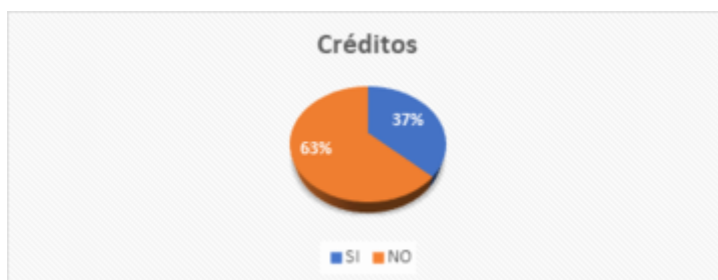
GRÁFICO 8 Créditos

Investigación de campo Elaboración propia