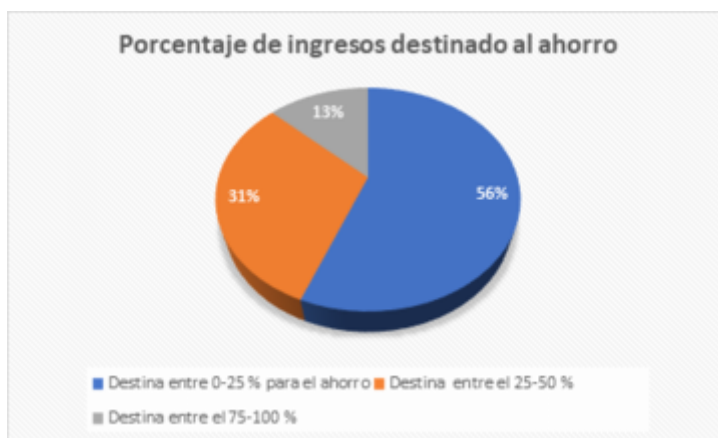
GRÁFICO 5 Porcentaje de ingresos destinado al ahorro Investigación de campo Elaboración propia

El 60% se destina para la inversión hasta el 25% de sus ingresos mensuales, lo que representa la mayoría; mientras que el 30% otorga a este rubro 25 al 50% de sus ingresos; y solo un 10% destina entre el 75 al 100% de sus ingresos a la inversión. Estos resultados son positivos ya que existe una educación financiera en las personas. Aunque puede ser más alta, su capacidad de ahorro es significativa, lo que nos permite interpretar algunos comportamientos del personal encuestado: no deben ser personas en su gran mayoría, consumistas, apegados a lo material, lo que resulta novedoso para el trabajo que se pretende realizar.