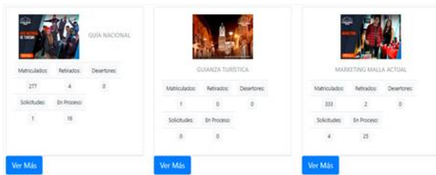
FIGURA. 1. Dashboard General. Sistema de Gestión Académica Ignug.

La opción “Ver más” de la figura 1, permite visualizar el detalle de las matrículas de la carrera por periodo nivel, jornada y paralelo.