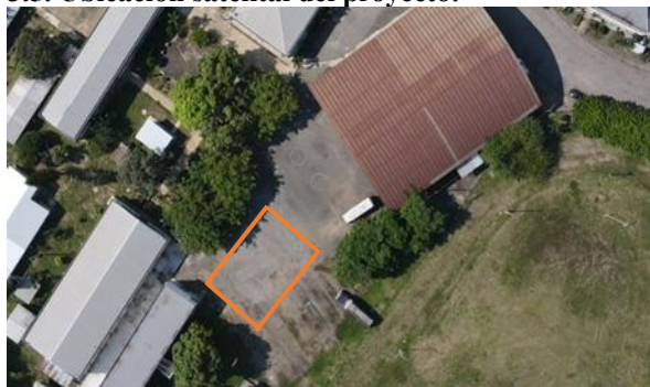
Figura n°2: Vista aérea del lugar delimitando la Ubicación el proyecto