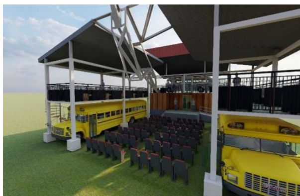
Figura N°1: Vista general del proyecto el cual tiene capacidad para 100 personas para butacas y 10 personas de pie en planta baja y 15 personas de capacidad en planta alta