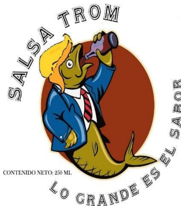
Fig. 3. Etiqueta frontal, diseño, contenido y nombre del producto

del mismo, destacando los macronutrientes de este. A continuación, se detallan los requisitos específicos que deben contener las tablas con las propiedades nutricionales para el producto elaborado, en este caso una salsa: Nombre del Alimento, Contenido Neto, Lista de Ingrediente, Marcado de Fecha de conservación y Registro Sanitario, Identificación del Fabricante, País de Origen. Hay que destacar que las salsas serán envasadas en botellas de vidrio de 250 ml de medida, dentro de la cual caben alrededor de 1.5 porciones establecidas (250 ml) adicionalmente la etiqueta elegida para el producto se muestra a continuación, se trata de una etiqueta de vinilo debido a que este no se ve afectado por la humedad en la que estaría sometida este producto a diferencia de una etiqueta de papel que se deterioraría con facilidad.