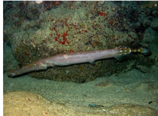
Fig. 1. Características del pez trompeta Aulostomus strigosus

amarillo vivo. En cuanto a su cuerpo tiene un patrón de líneas, verticales y/u horizontales, pálidas. Una franja negra, a veces reducido a una mancha oscura, se produce a lo largo de la mandíbula. Las aletas dorsal y anal son claras de aspecto similar con una barra oscura basal, y ubicadas de forma opuesta en la parte trasera del cuerpo. Cuenta con un par de puntos negros en la aleta caudal y también con otro en cada base de las aletas pélvicas. Su tamaño radica de 60cm de longitud hasta los 80cm. [1]