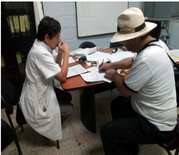
Anexo 3. Entrevista a expertos o profesionales conocedores del tema