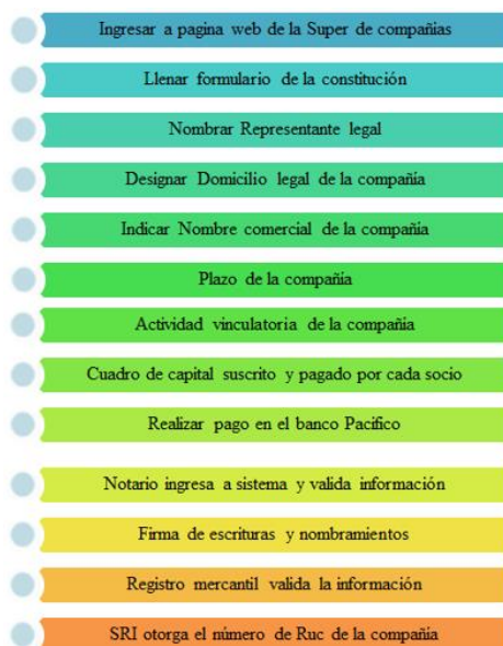
Fig. 3. Requerimientos para constituir una empresa.

El impuesto se paga de forma mensual y de manera semestral cuando la transacción grava IVA 0%, y el día depende del último dígito del Ruc.