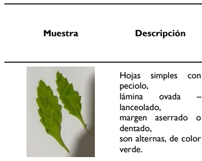
Tabla I. Descripción morfológica de la hoja de Paico.

En la siguiente tabla I describimos la macromorfología de las hojas de paico en referencia a lo planteado en el libro de Aguirre et al 2019 (9)