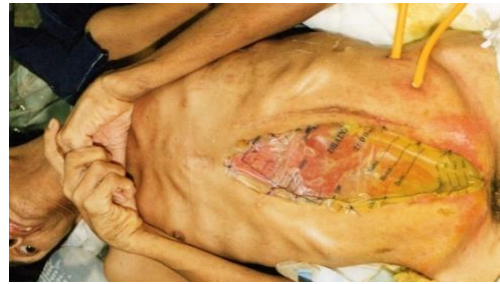
Figura 2. Factores de riesgo: anciano, desnutrido y enfermedad crónica.

La hipoproteinemia (las proteínas son muy importante en la formación de colágeno), el déficit de vitaminas (la vitamina C actúa en la síntesis de colágeno, la vitamina A estimula la epitelización, la vitamina E estabiliza la cicatriz) retrasan el proceso de reparación de la cicatriz quirúrgica o de la anastomosis.