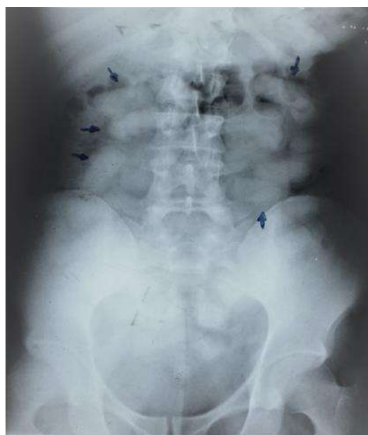
Ilustración 1 Radiografía. Presencia de capsulas