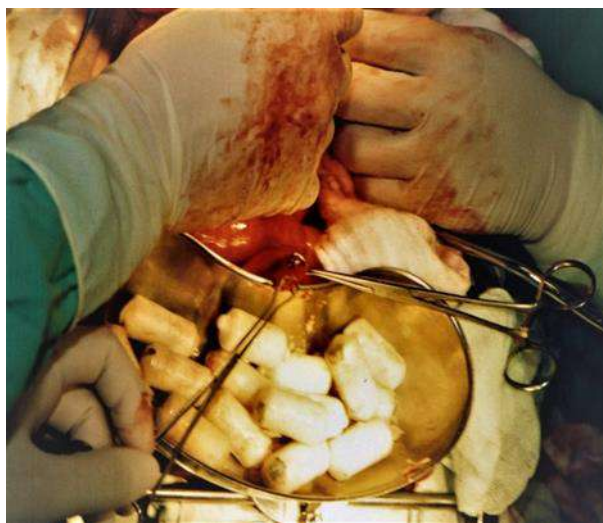
Ilustración 3 Extracción de capsulas de cocaína