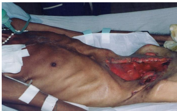
Figura 2 Fistulas entero-atmosférica (flechas), destrucción de tejidos y quemadura local.