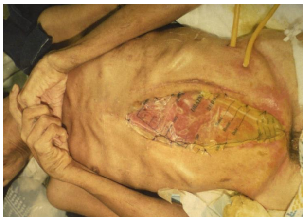
Figura 1 Paciente con fistula y factores de comorbilidad: desnutrido, disproteínico, inmunodeprimido y patología abdominal aguda.