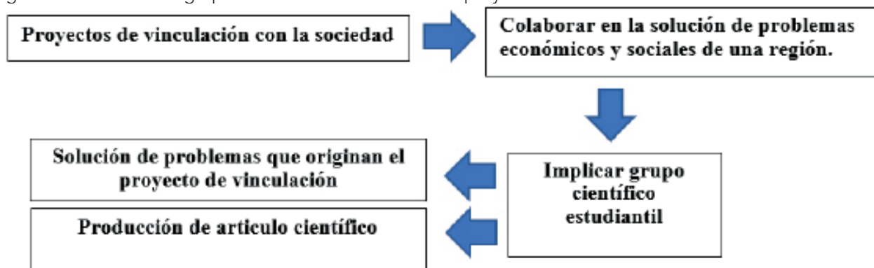
Figura 2. Incidencia de grupo científico estudiantil en los proyectos de vinculación