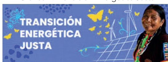
Gráfico 1: Transición Energética Justa