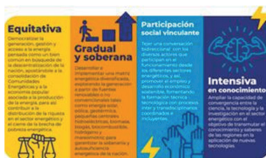
Gráfico 3: Cambios hacia una transición energética justa en Colombia