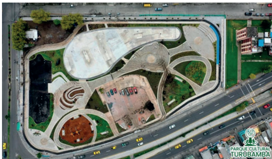
Imagen 2 Implantación del Parque Cultural Turubamba a 1 mes antes de su inauguración municipal.

Ninguno de estos compromisos se están cumpliendo.