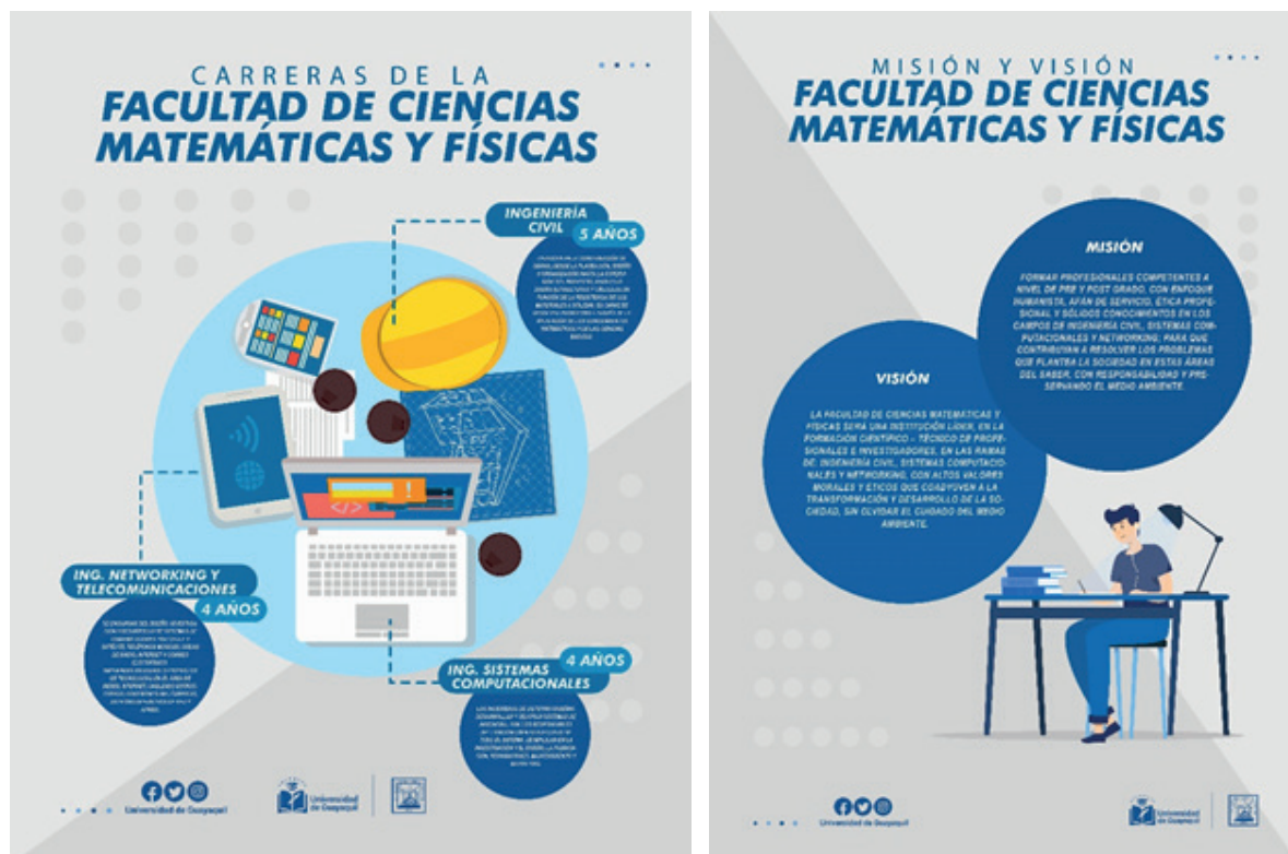
Gráfico 3: Propuestas Realizadas