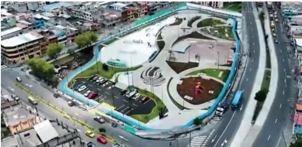
Imagen 3 Parque Cultural Turubamba a 1 año después de su inauguración municipal.

El trabajo arduo de la comunidad derivó en el Parque Cultural Turubamba, un hito en infraestructura cultural en el Distrito Metropolitano de Quito, que, en 1,1 hectáreas se encuentran varias actividades para todas las edades y a pesar de que faltan compromisos por cumplir, ya lleva mas de un año de uso continuo.