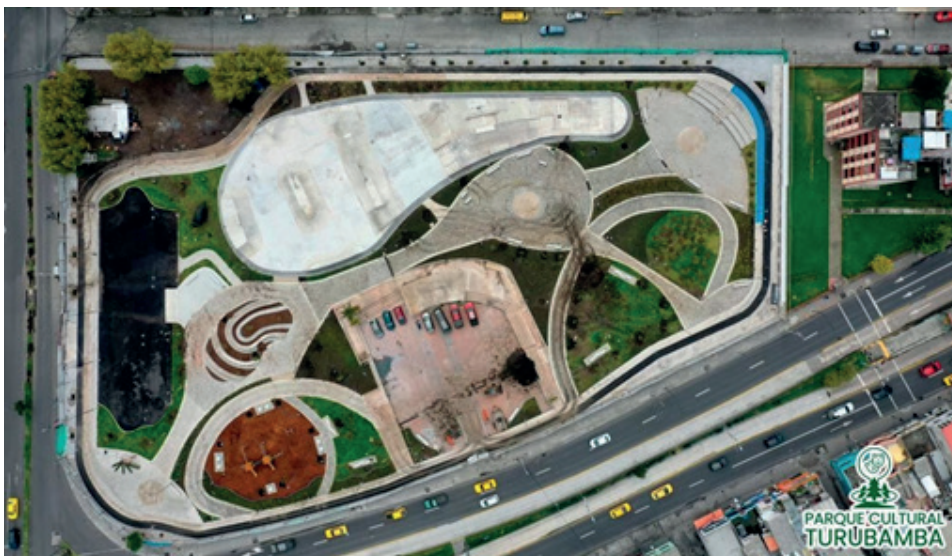
Imagen 2 Implantación del Parque Cultural Turubamba a 1 mes antes de su inauguración municipal.

Ninguno de estos compromisos se están cumpliendo.