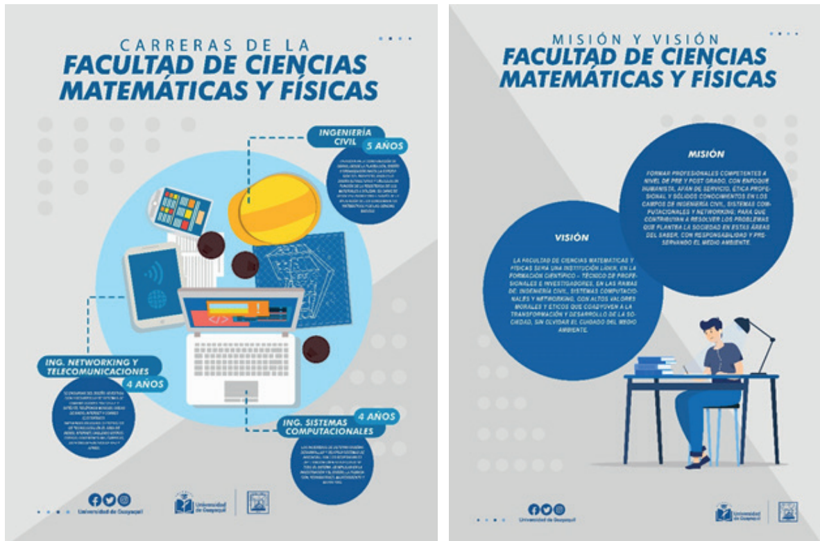
Gráfico 3: Propuestas Realizadas