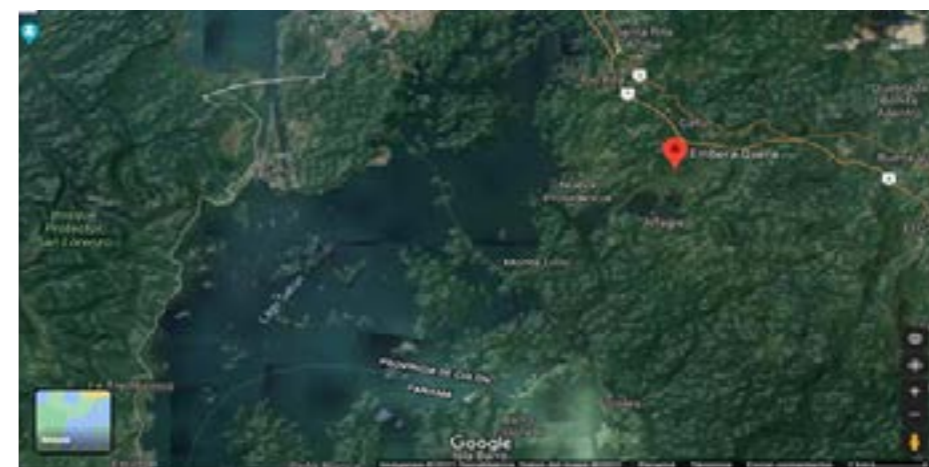
Figura 1: Localidad del Sitio de Estudio.

Este estudio de tipo básico, exploratorio, no experimental, transversal, se realizó entre los meses de abril de 2021 y marzo de 2022, en la comunidad Emberá Querá ubicada en la sub cuenca del Río Gatún, 9.273105, -79.778397, Corregimiento de Limón, Provincia de Colón, Panamá. Se accede a la comunidad por el Río Gatún y el Lago Gatún el cual se constituye en su principal atractivo turístico y fuente de proteína animal (Figura 1).