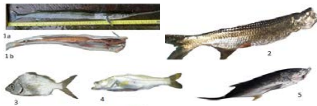
Figura 4. Peces Periféricos en Lago Gatún

Algunos peces periféricos entran y se establecen en el Lago Gatún donde crecen hasta adultos: Caranx latus (jurel), Centropomus undecimalis (Robalo), Diapterus auratus (mojarra), Megalops atlanticus (sábalo real) y Ablennes hians (pez aguja) (Figura 4), logrando completar su ciclo de reproducción. De las especies previamente registradas para el Lago Gatún (Aversa et al, 2004; CEREB, 2005; PREPAC, OIRSA y OSPESCA, 2005) en este estudio se adicionan: Ablennes hians (pez aguja), Caranx latus (Jurel) y Chaetostoma fischeri (Wuacuco).