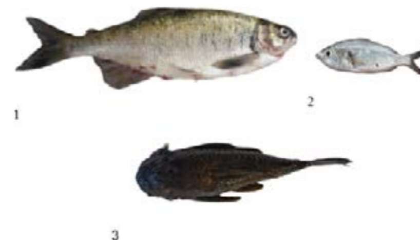
1. Brycon chagrensis 2. Astyanax aeneus 3. Chaetostoma fischeri 03-10-21

La distribución de peces dulceacuícolas (54.5 %) en este estudio es similar a la reportada por Averza et al (2004), quien indica que, en el Lago Gatún, la composición de peces es mayormente de agua dulce. De las tres especies de peces primarios registrados en este estudio, el Brycon chagrensis (sábalo pipón) es considerado una especie endémica para Panamá Fundación Panamá, 2007) con una distribución en América Central, Río Chagres, vertiente Caribe de Panamá (FishBase, 2022).