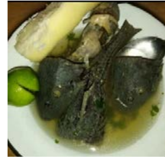
Fotógrafo Renán González 5 -11-22

La Tilapia es otro pez con alto valor de uso para los Emberá Querá; la carne es blanca y con pocas espinas, además lo asocian con alto valor nutricional, ellos lo consumen como un plato autóctono, tilapia sudada en hoja de bijao con plátano sancochado, además, se lo ofrecen a los turistas como parte del paquete de ecoturismo. El éxito de pescar tilapias es alto, desde el punto de vista de los encuestados, posiblemente esta afirmación esté relacionada con el hecho de que las Tilapias son peces que se adaptan a diferentes ecosistemas, tanto de agua dulce (ríos, lagos, lagunas) como salada (Allard, 2018), además soportan un amplio rango de temperaturas (8°C a 30°C), y salinidades (Chervinski 1983) y son organismos herbívoros (Rodríguez y García 2009).