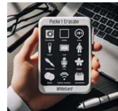
Pizarra Borrable de Bolsillo

Elaborado por: MSc. Carlos Alberto Samaniego Torres.