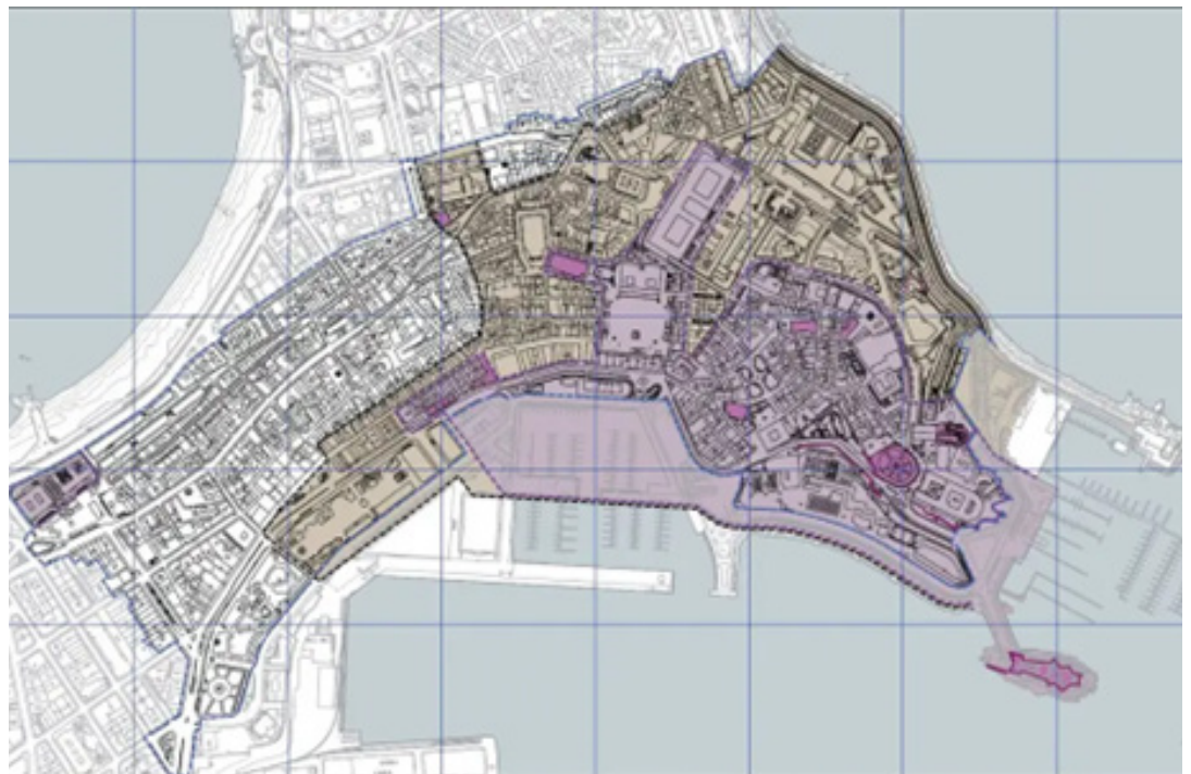
Figura 3: Pepri A Coruña.- Zonificación de espacios protegidos por el Plan. Google Maps. (2025)

En el que se aprecia las dos zonas protegidas, la ciudad vieja en color morado y la zona de la Pescadería en color amarillo, y remarcado en líneas punteadas rojas la zona ampliada para definir el emplazamiento.