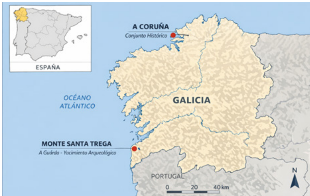
Figura 1: Ubicación de casos de estudio. (2025)

En una segunda fase se adopta una metodología de estudio de casos, seleccionando dos intervenciones reales desarrolladas en Galicia que presentan distintos niveles y tipologías de protección patrimonial: Rehabilitación urbana de un inmueble dentro del Conjunto Histórico de A Coruña declarado Bien de Interés Cultural y la Intervención de una edificación en un entorno arqueológico protegido de alto valor patrimonial (Monte Santa Trega).