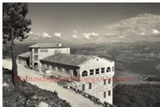
Figura 12-13: Tomado de informe evaluación, Arqueóloga Rosa Quintero. Todoimagenes.net. (2025)

Alda Rías Baixas, SL promueve las obras para la instalación de un ascensor, escaleras de emergencia y otras obras menores para adaptar los aseos y la carpintería del edificio a su funcionamiento como hotel. Esta actualización, implica modificar las instalaciones para el correcto cumplimiento de la normativa vigente, en los que tiene relevancia en este proyecto es el de DBHSI sobre seguridad y vías de evacuación, por lo que se tuvo que