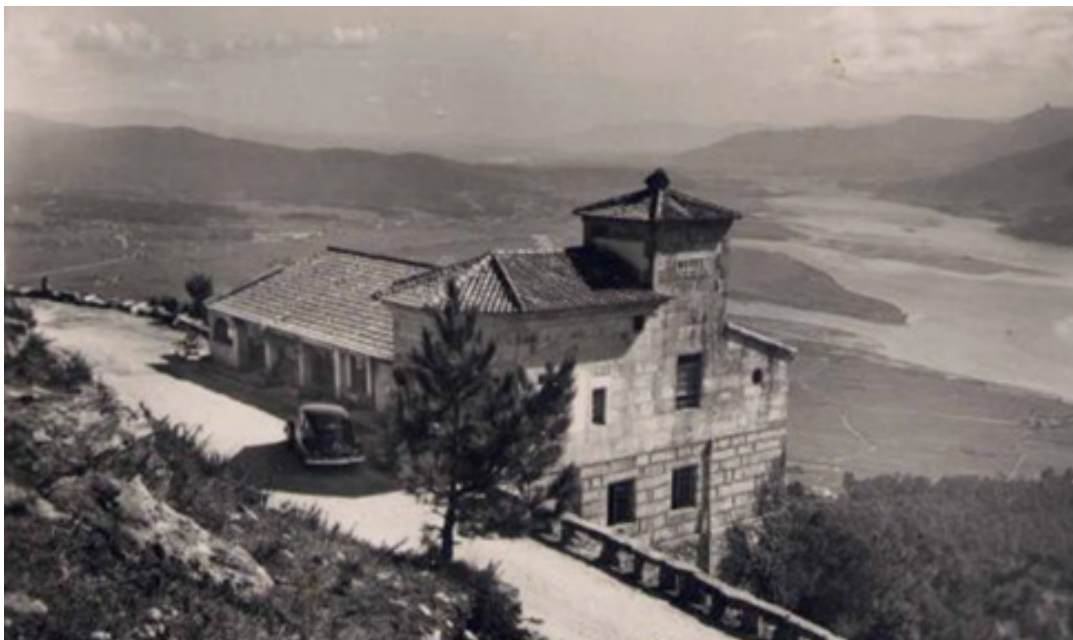
Figura 11: Construcción Inicial 1930