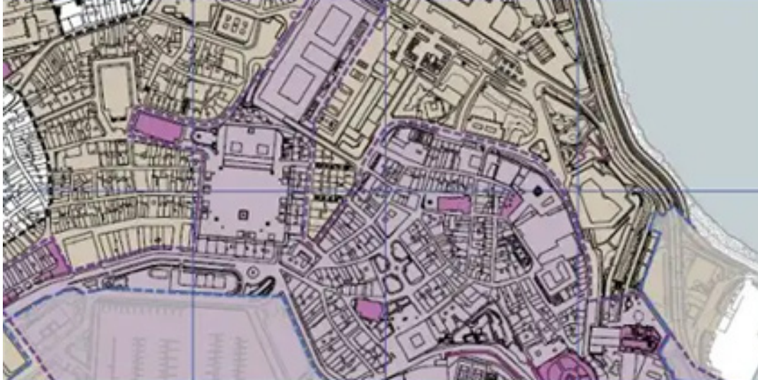
Figura 4: Ubicación. Alda Alboran Rooms. Google Maps. (2025)

Dentro de este entorno en la calle riego del agua 15, se encuentra localizada la edificación a estudio. (Figura 4-5)