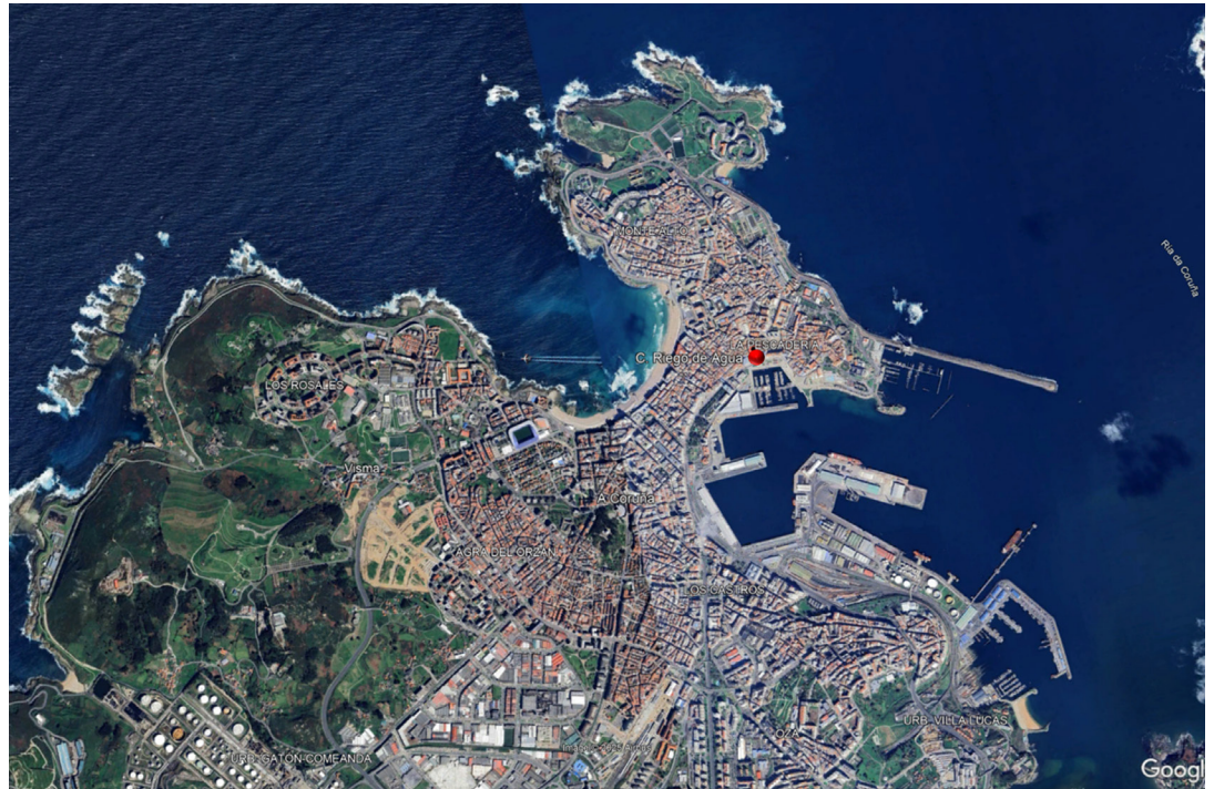
Figura 2: Ciudad A Coruña.

El proyecto de la reforma del hotel, se encuentra en una zona protegida del denominado Plan Especial de Protección y Reforma Interior de la ciudad Vieja y Pescadería vigente, se aprobó definitivamente por el Pleno Municipal en sesión de 26 de enero de 2015. (Figura 3).