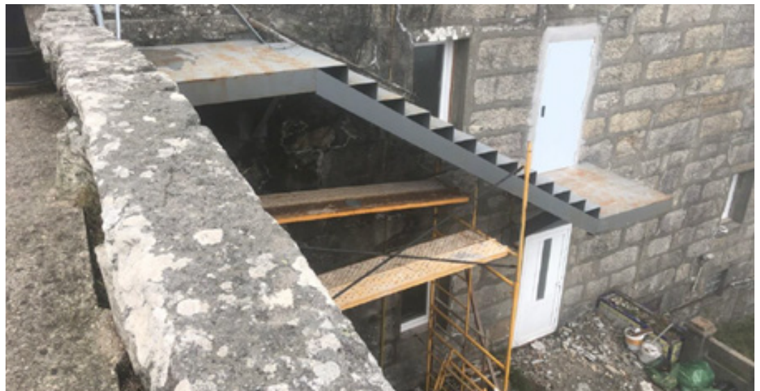
Figura 15: Tomado De Informe Evaluación - Arqueóloga Rosa Quintero. Fachada Sur Con Escalera De Emergencia En Obras. (2025)

da a la zona de aparcamientos del hotel. El anclaje a la terraza creada para la construcción del camino de acceso no constituiría un daño patrimonial, (figura 15) puesto que ha sido un acceso abierto durante años; actualmente, la superficie es la roca madre, como se demostró en el control realizado durante la instalación de la iluminación.