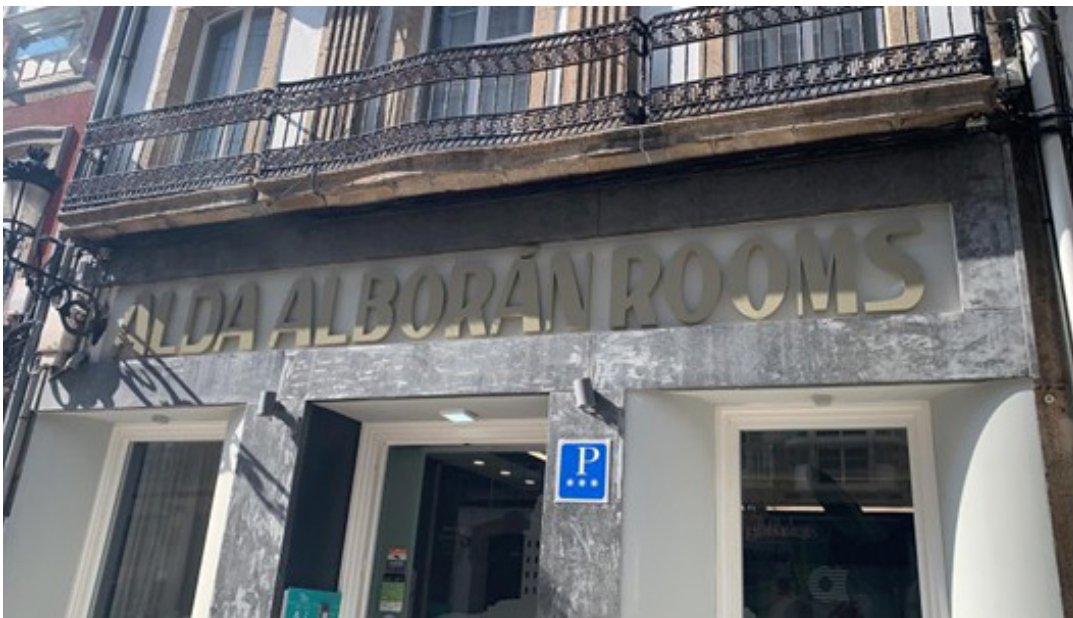
Figura 8: Archivo Fotográfico Departamento De Obras – Alda Hotels. Proyecto Finalizado – Estado Actual.