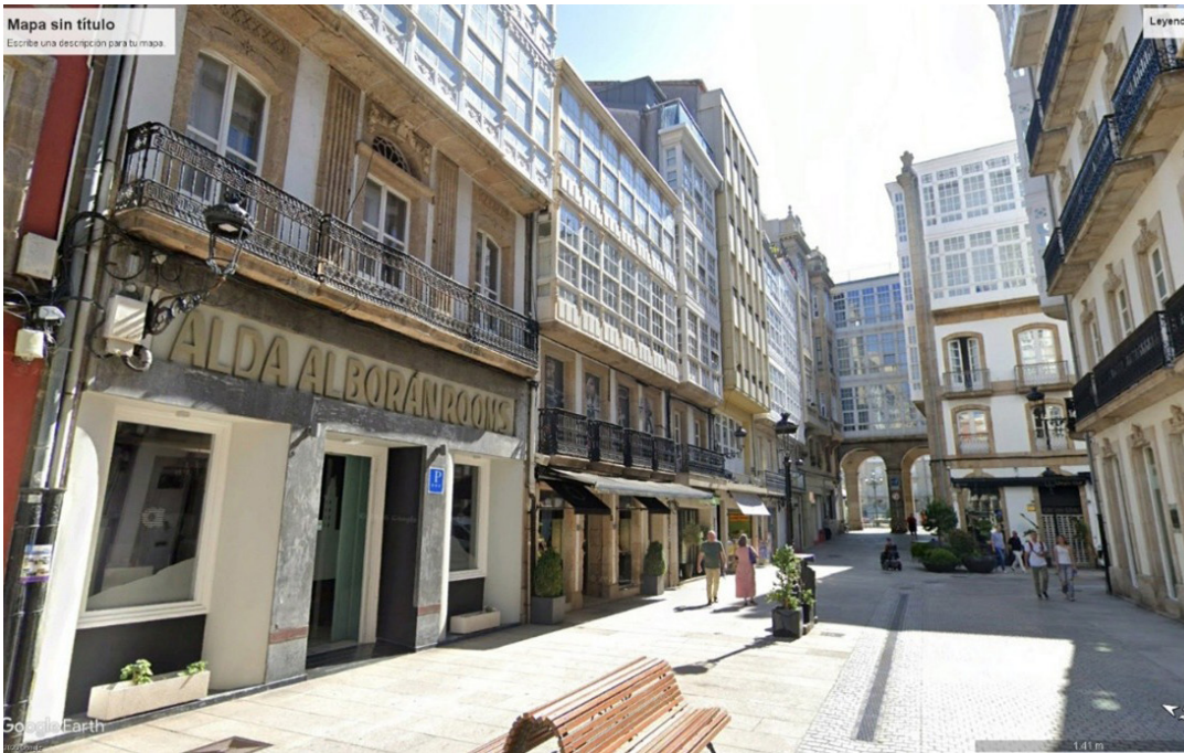
Figura 5: Vista del entorno del Conjunto Histórico, calle Riego de Agua. Google Maps. (2025)