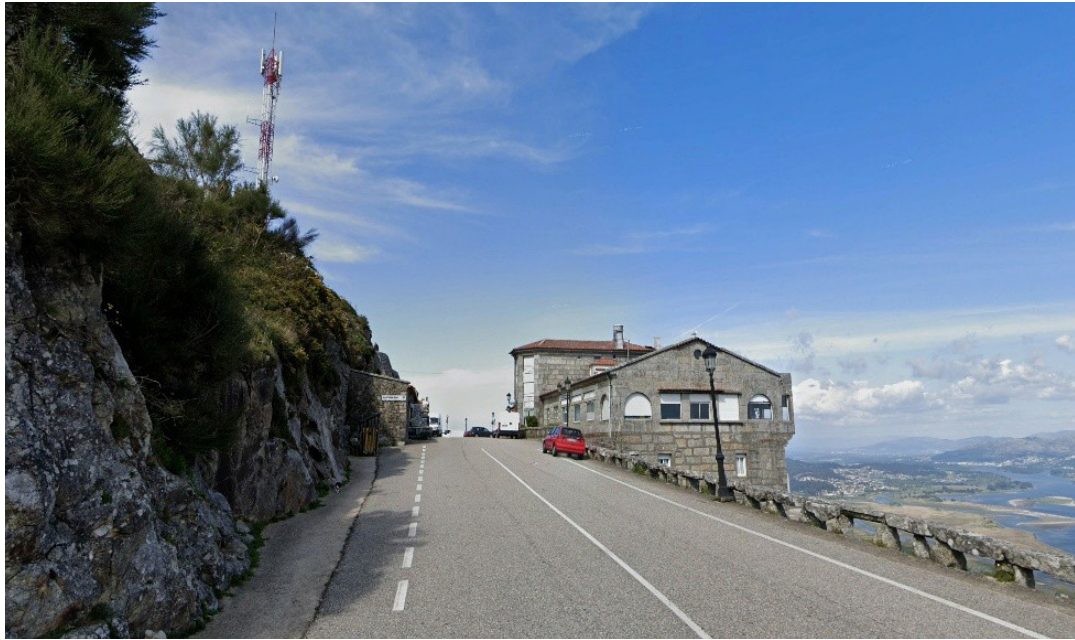
Figura 16: Fachada Sur Con Escalera De Emergencia En Obras Finalizada. (2025)

un impacto sobre el patrimonio, puesto que se trata de zonas de reforma de la pendiente para la construcción del camino, hasta el mismo lecho rocoso. (figura 16) La necesidad de retirar algunos sillares del umbral para dar cabida a la escalera no difiere de la valoración anterior, pero deben sustituirse por un elemento físico que impida el acceso desde la calle.